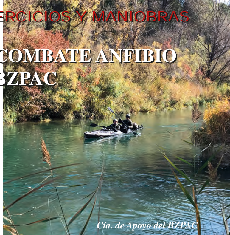
Cía. de Apoyo del BZPAC

El Pelotón de Navegación y Buceo (BZPAC) en labores de equipo de reconocimiento, tiene el cometido de instruir a su personal en el combate anfibio. En él se incluyen ejercicios en el medio acuático, tanto en piscina como en ríos y pantanos, y en el que se realizan prácticas de aleteo, de navegación con embarcaciones con y sin motor y de buceo.