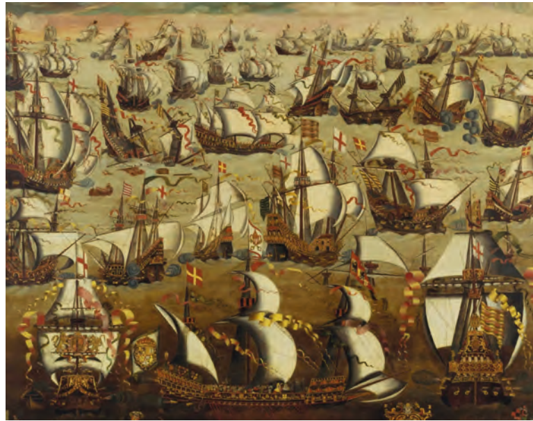
El Rgto. Zaragoza participa embarcado en la batalla naval de las Gravelinas (1588)