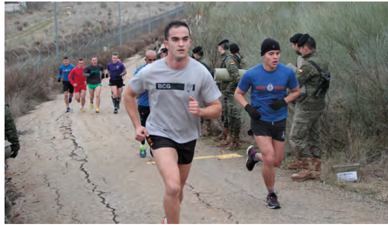
Un momento de la prueba de cross largo