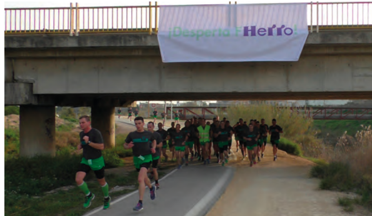
Pancarta de ánimo durante el cross “Cap. Verde”