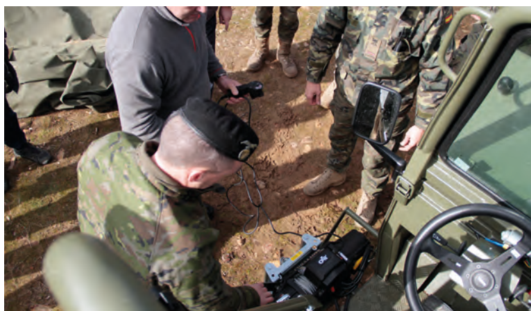
Ubicación del cabrestante en el lateral del conductor

Para verificar su rodaje, la empresa EINSA proporcionó seis MM-1 A Mk-2, consistiendo la prueba en que cada una de las Mulas recorriera al menos una distancia de 240 Km como mínimo, tanto en carretera como campo a través. La prueba de rodaje, se realizó en el Campo de Maniobras de Uceda (Guadalajara), comprobando sobre el terreno que la suma de un buen motor, un reducido peso y unos magníficos neumáticos hacen que el vehículo supere cualquier terreno al que se le enfrente.