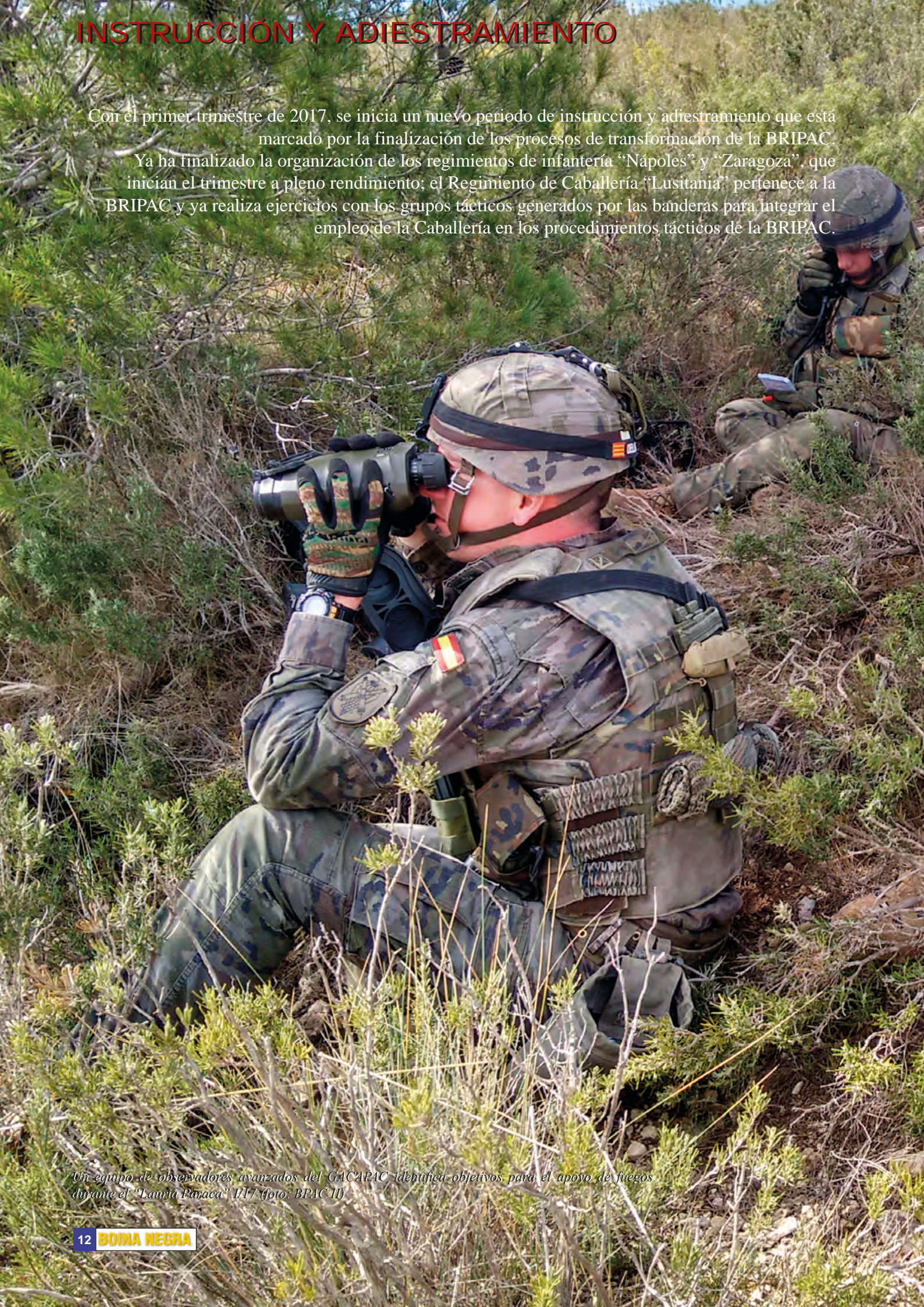
Un equipo de observadores avanzados del GACAPAC identifica objetivos para el apoyo de fuegos durante el "Lauria Paraca" I/17

Con el primer trimestre de 2017, se inicia un nuevo periodo de instrucción y adiestramiento que está marcado por la finalización de los procesos de transformación de la BRIPAC. Ya ha finalizado la organización de los regimientos de infantería “Nápoles” y “Zaragoza”, que inician el trimestre a pleno rendimiento; el Regimiento de Caballería “Lusitania” pertenece a la BRIPAC y ya realiza ejercicios con los grupos tácticos generados por las banderas para integrar el empleo de la Caballería en los procedimientos tácticos de la BRIPAC.