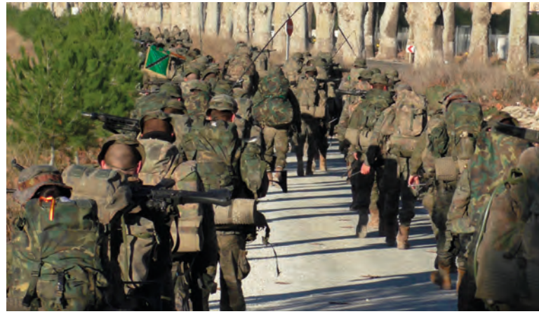
Imagen de la columna de marcha

Finalmente llegamos a nuestro objetivo y por tanto cumplimos la misión. Los más de 400 paracaidistas que iniciaron esta peregrinación la finalizan con éxito sin más novedad que el cansancio acumulado después de unos pocos kilómetros recorridos. Y en este Santuario de Caravaca de la Cruz, que custodia el Lignum Crucis , los paracaidistas participan masivamente en la misa del peregrino.