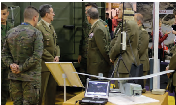
El JEME interesándose por los medios UAV

La BRIPAC ha sido la responsable de liderar y coordinar el montaje y funcionamiento del stand que el Ejército de Tierra instaló en IFEMA, entre los días 14 y 16 de marzo, con motivo del Salón Internacional de Tecnologías de la Seguridad Nacional (HOMSEC17).