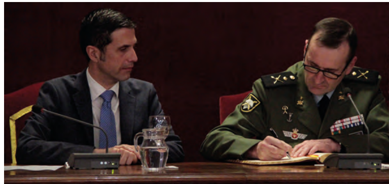
Foto superior: el Gral. firma en el Libro de Autoridades Foto inferior: el Gral. recibe la moneda conmemorativa del 400 Aniversario de Cervantes