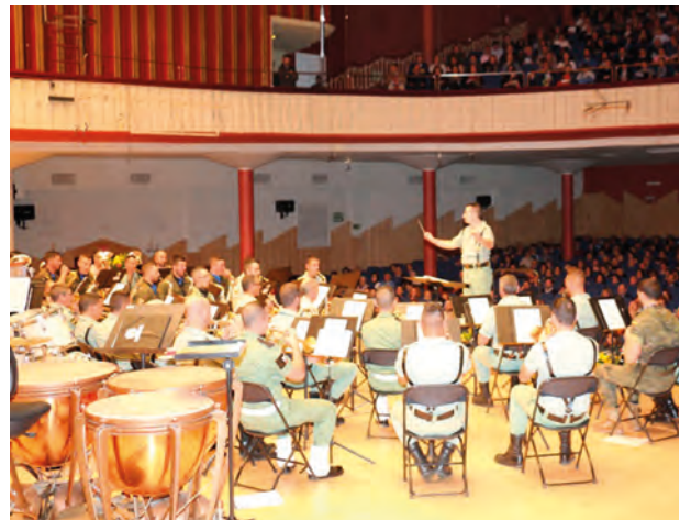
Concierto de música

Por último, en la parada militar participó el Guión de la BRIPAC, la Banda de Guerra y una Batería de Honores del Grupo de Artillería.