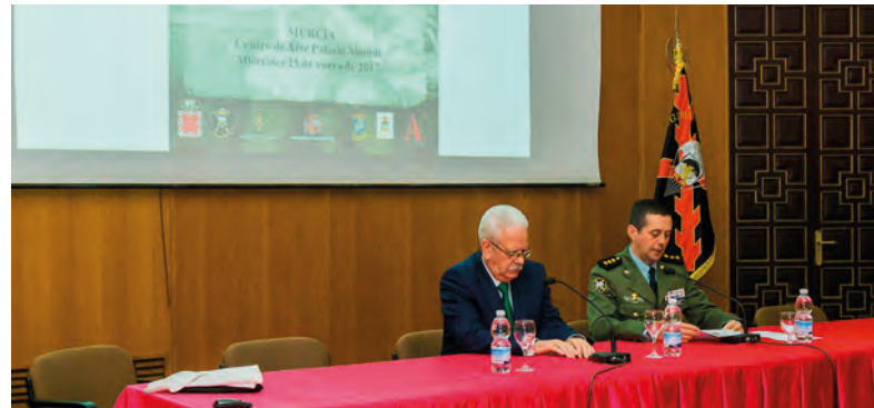
Momento de la presentación del General Ramos Oliver