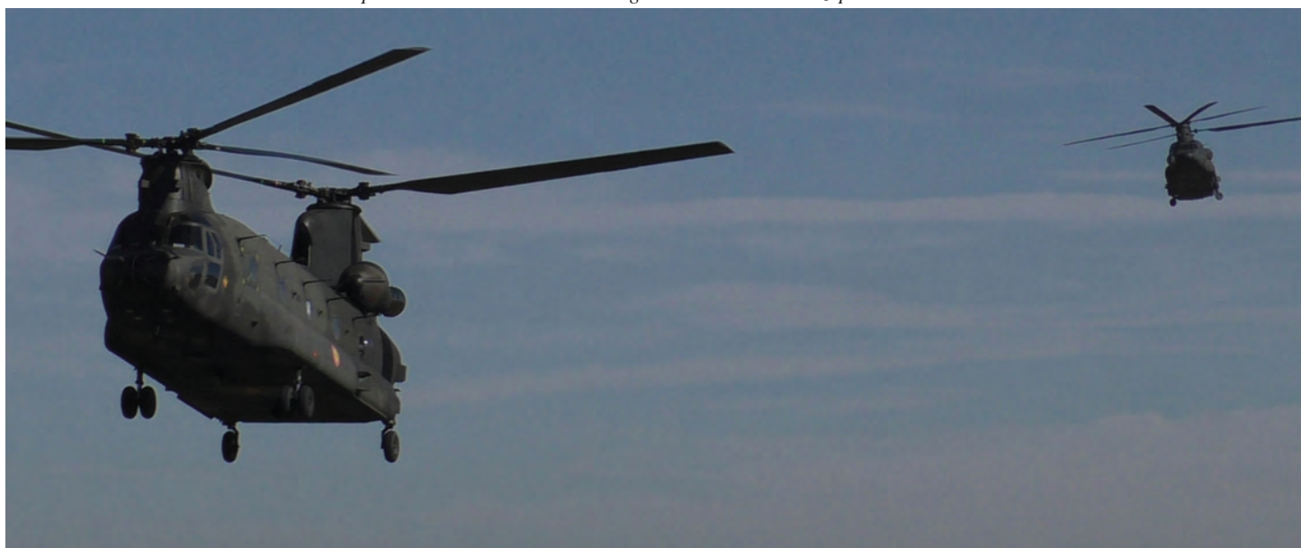
Helitransporte de S/GT 12 donde se integraba una sección de zapadores