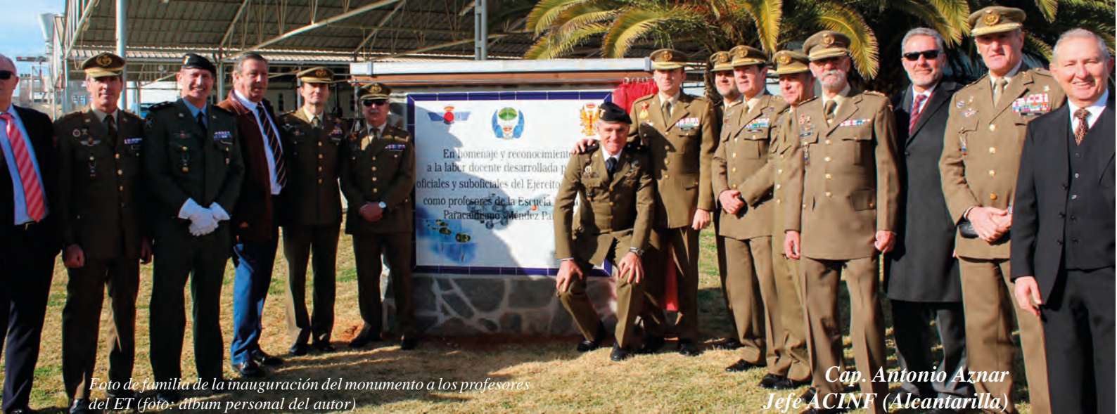
Foto de familia de la inauguración del monumento a los profesores del ET