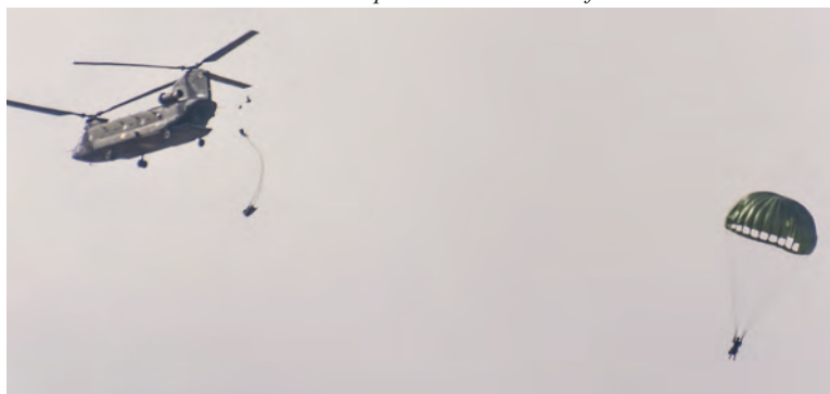
Inserción de la 3. a Cía por lanzamiento paracaidista