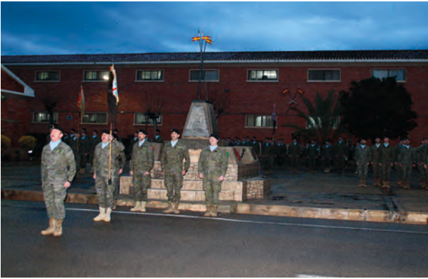
Un momento de la formación del Lusitania