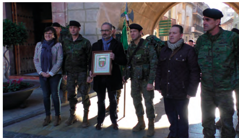
Encuentro con la corporación municipal de Caravaca