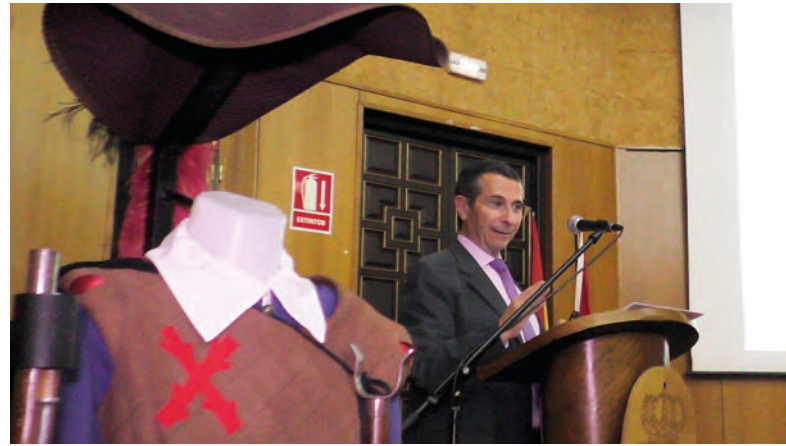
Un momento de la conferencia del TG. Muro

Yo no sé qué tiene esta profesión, a pesar de los sacrificios, los riesgos, las penurias e ingratitudes, son tantas las satisfacciones, que se está orgulloso de pertenecer a ella, y deseoso de continuar siempre en sus filas.