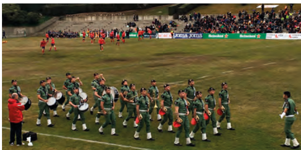
La Banda de Guerra se incorpora al estadio

La Banda de Guerra de la BRIPAC, a petición de la Federación Española de Rugby, interpretó los himnos de Rusia y España en el partido internacional, valedero para el Campeonato de Europa, que ambas selecciones disputaron el día 11 de febrero en el estadio de rugby de la Ciudad Universitaria y que finalizó con triunfo de España.