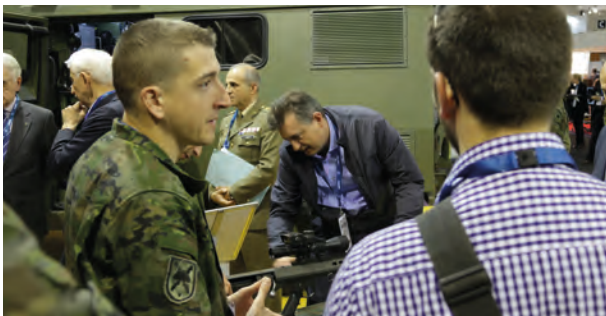
Visitantes interesándose por el material de la BRIPAC