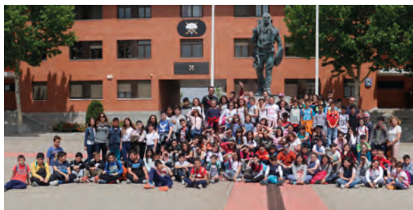
Foto de familia de la visita

Tras una charla sobre la historia, misión y capacidades de la Unidad, se dividieron en dos grupos y visitaron las instalaciones de instrucción y el museo, donde pudieron conocer la historia de nuestra unidad a lo largo de los años.