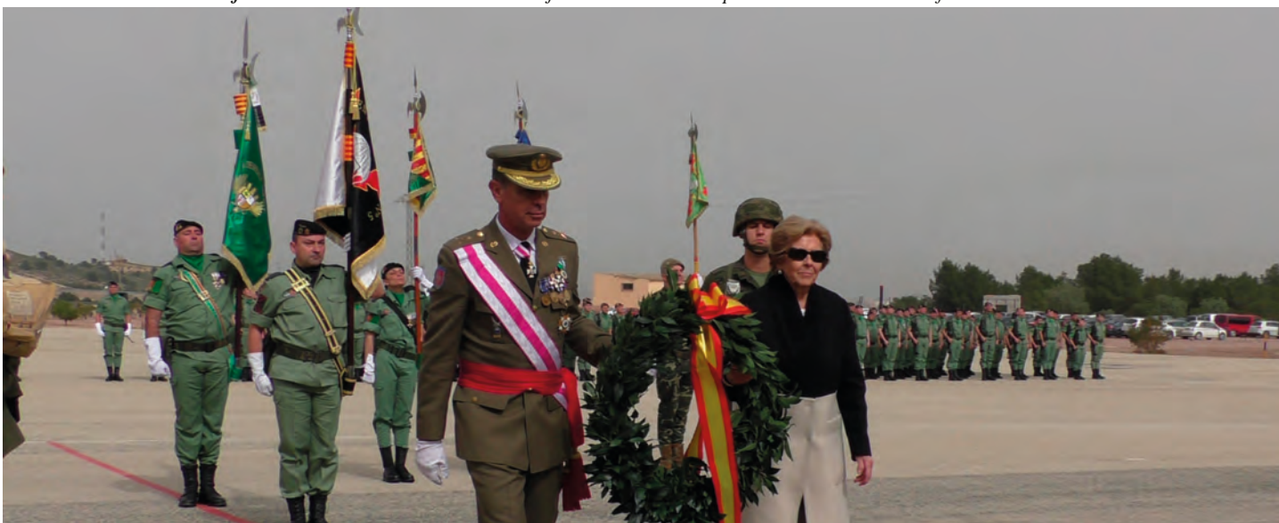
Foto inferior: momento del acto de homenaje a los caídos en la parada militar del 23 de febrero