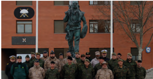
Foto de familia de la visita

El X Curso de Inteligencia de las FAS nos visitó el día 26 de enero para conocer las capacidades de la BRIPAC en lo relacionado con la Función Combate Inteligencia, así como el concepto ISTAR (Intelligence, Surveillance, Target Acquisition and Reconnaissance; Inteligencia, Vigilancia, Adquisición de Objetivos y Reconocimiento).