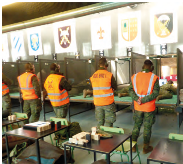
Un momento del campeonato

El pasado día 8 de marzo se celebró en la Base “Príncipe” el campeonato de tiro con arma larga de la Jefatura de Apoyo a la Preparación Centro (JEAPRECEN) 2017, en el que participaron diferentes unidades del ámbito de dicha Jefatura.