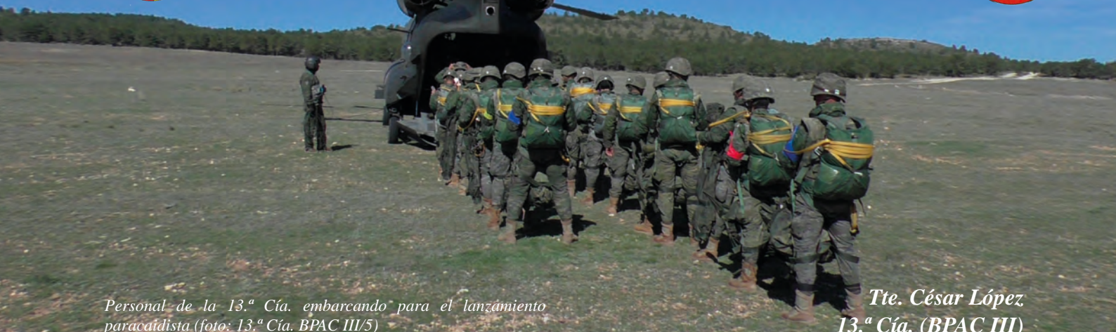
Personal de la 13.ª Cía. embarcando para el lanzamiento paracaidista