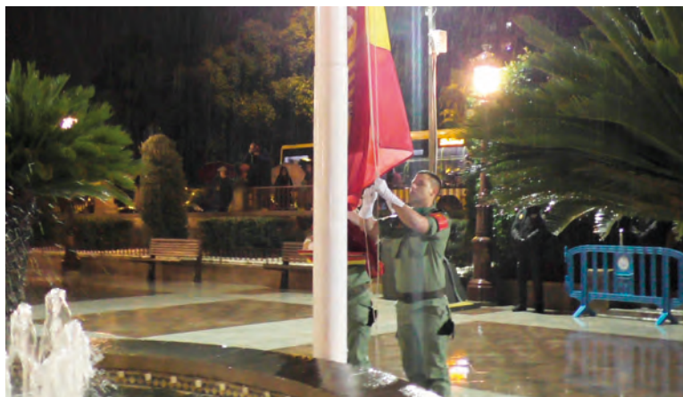
Acto de arriado de la Bandera

Grandes escritores españoles fueron también soldados. Lope de Vega, en la Escuadra de Alvaro de Bazán en la conquista de las Azores a bordo del Galeón S. Juan; Calderón de la Barca, en la Bandera del Duque de Alba en los gloriosos tercios de Flandes. Aquellos de los que el gran Calderón dejó escrito: