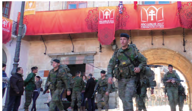
La BPAC III entra en la localidad de Caravaca