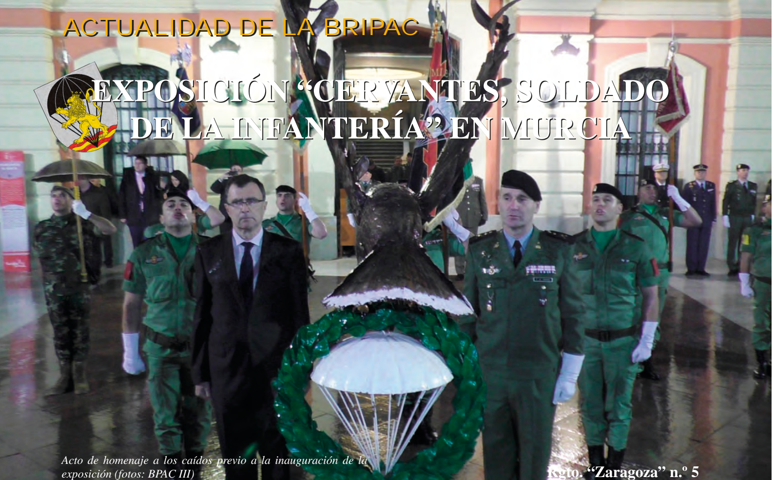
Acto de homenaje a los caídos previo a la inauguración de la exposición