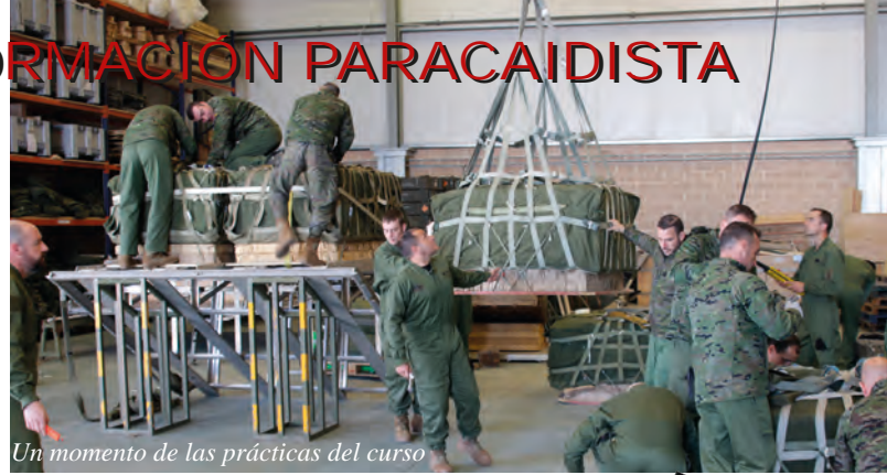
Un momento de las prácticas del curso