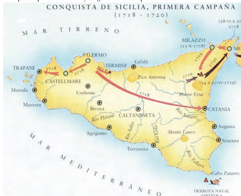
Foto inferior: campaña de Sicilia entre 1718 y 1720, donde participó el Lusitania y se ganó la escarapela amarilla