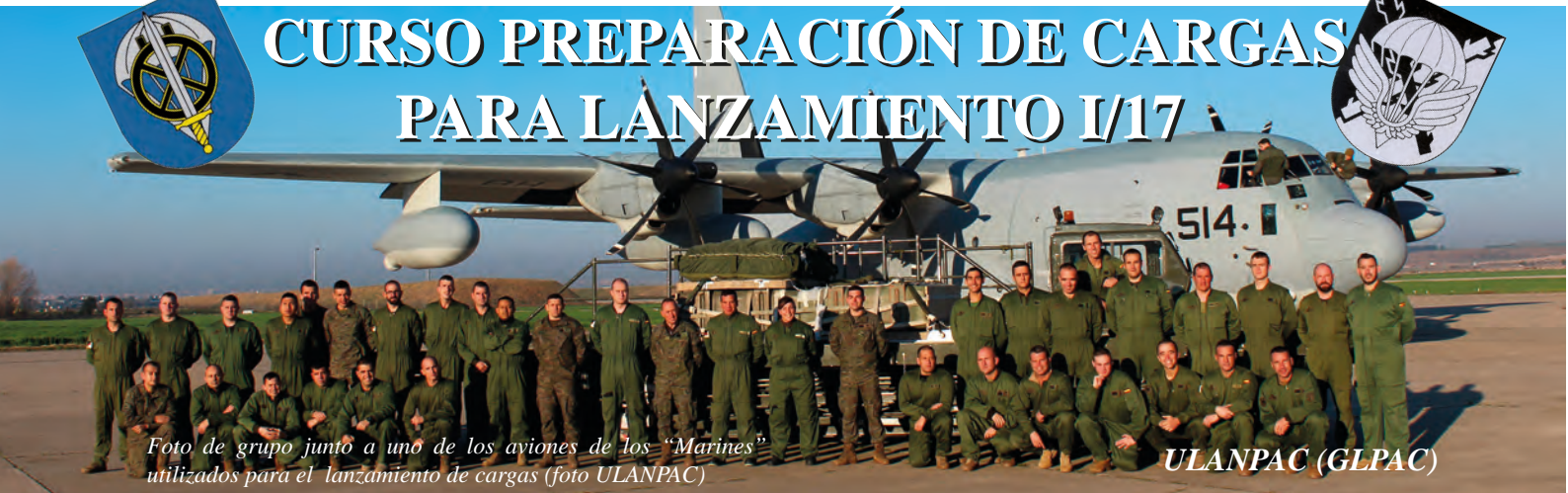
Foto de grupo junto a uno de los aviones de los "Marines" utilizados para el lanzamiento de cargas