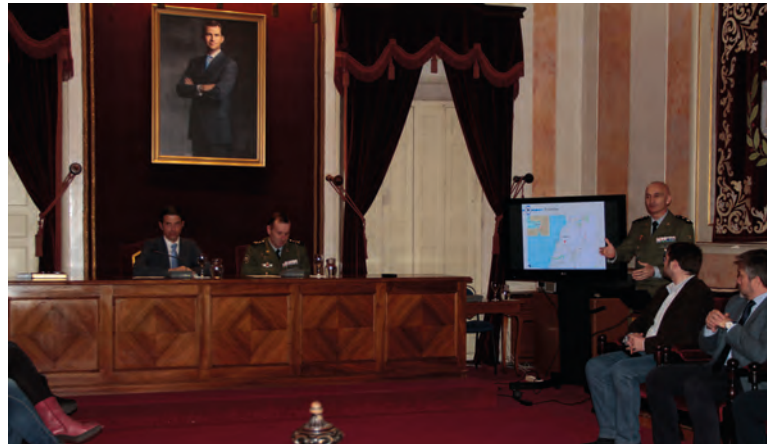
El JEM durante la exposición sobre la misión