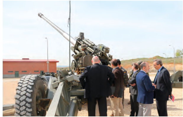
La delegación observa la pieza en posición

A continuación presenciaron una exposición dinámica, con una entrada y salida de posición en modo remolcado y autopropulsado, donde se les mostraron las principales capacidades de la pieza