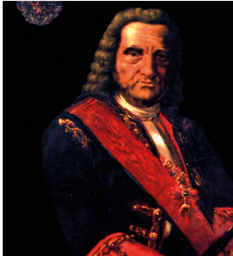
Foto superior: Jaime Miguel de Guzmán Dávalos y Spinola, Conde de Pezuela, fundador del Lusitania Foto inferior: dragón del Lusitania en 1763

Combate en la Guerra de la Independencia con el nuevo nombre de Regimiento de Cáceres, 8.º de Dragones, participando en las batallas de Tudela (1808) y Almonacid, donde extrema su valor. Participa también en el combate de la Solana y