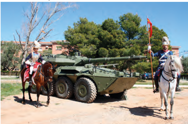
Monturas de ayer y de hoy

Una Sección del Escuadrón de Caballería de la Guardia Real visitó a sus compañeros de Arma en la Base “General Almirante” el día 24 de marzo.