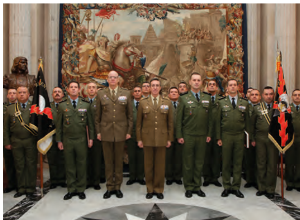
Foto de familia tras el acto