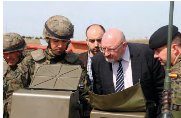
Interesándose por el sistema TALOS de la pieza