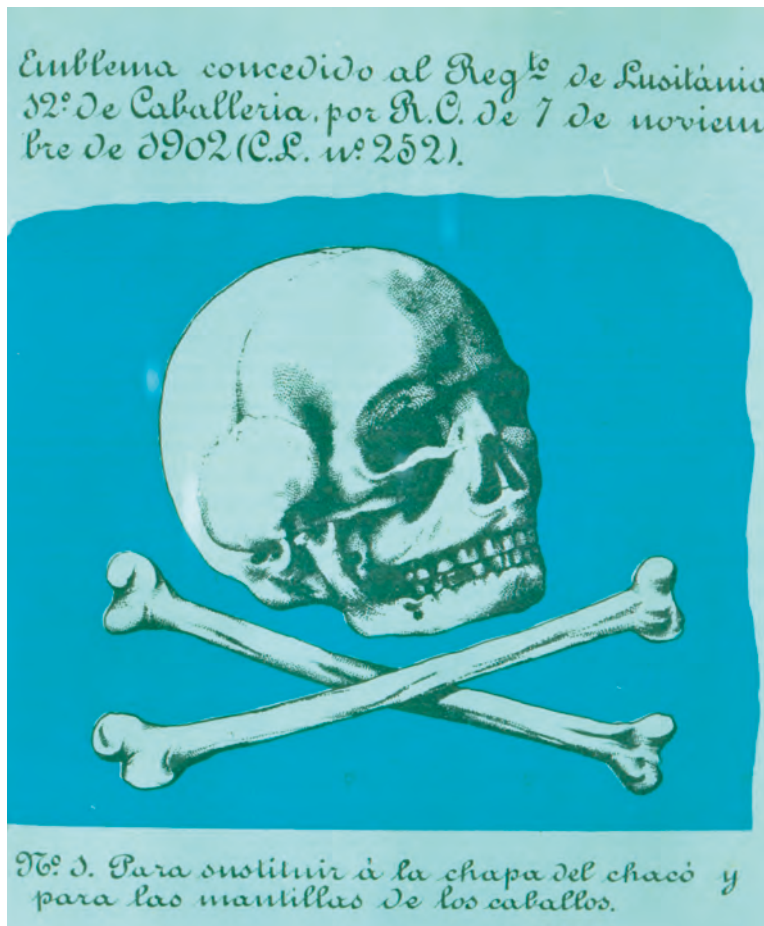
Foto superior: Emblema del Rgto. Lusitania desde 1902 Foto inferior: Guión histórico de los Dragones del Lusitania

En 1931 se fusiona con el Regimiento "Victoria Eugenia", creado en el año 1875, y del que fue nombrado coronel honorario la Reina D.ª Victoria Eugenia, el 10 de enero de 1918. De esta fusión nace en Valencia el Regimiento de Cazadores de Caballería n.º 7, que posteriormente, en 1935 tomará la denominación de Cazadores de