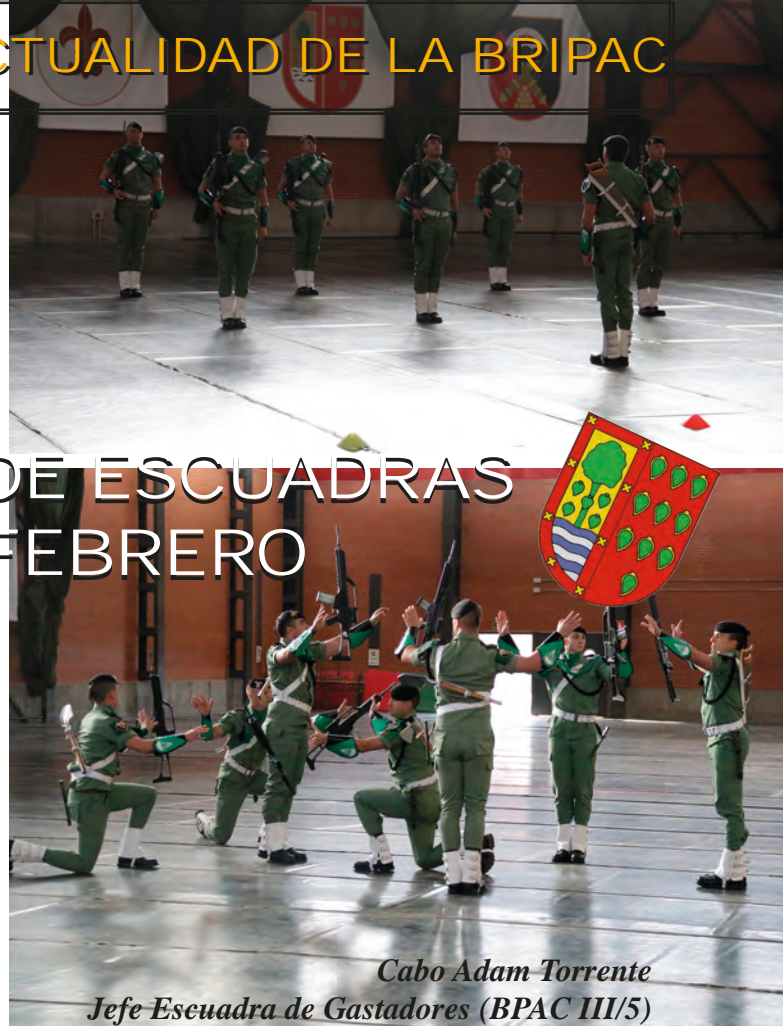
Diferentes momentos de la intervención de la Escuadra de Gastadores de la BPAC III en el concurso