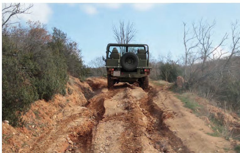
Subida de una pendiente durante las pruebas