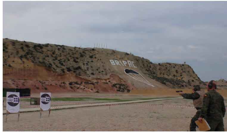
Un competidor durante la prueba de recorrido de tiro

Para finalizar, recordar que el espíritu paracaidista nos impulsa a lograr que la totalidad de los individuos que la integramos, sentirnos identificados con sus valores y objetivos, adoptándolos como propios, de tal manera que estamos orgullosos y renueven nuestros esfuerzos para ser el mejor soldado de la patria.