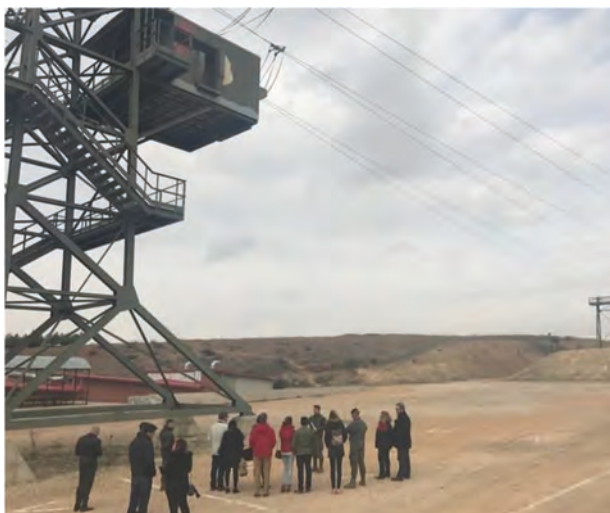
Un momento de la visita en el CIPAE