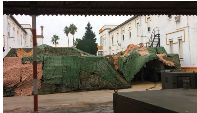
Diferentes vistas de los despliegues de las células de control y del PC de la División