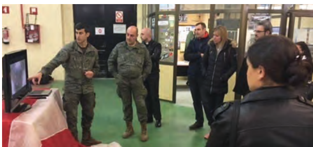
Un momento de la visita a la sala de plegados

El Máster Universitario de Derecho Militar, que imparte desde el pasado mes de octubre la Universidad Católica San Antonio de Murcia (UCAM) visitaron las instalaciones de la BRIPAC el día 3 de marzo.