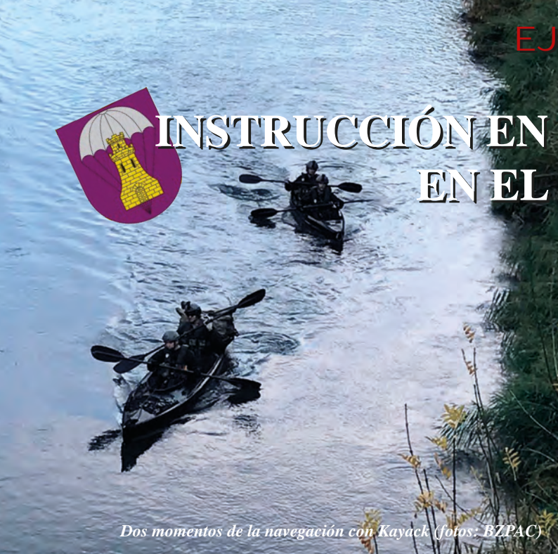
Dos momentos de la navegación con Kayack