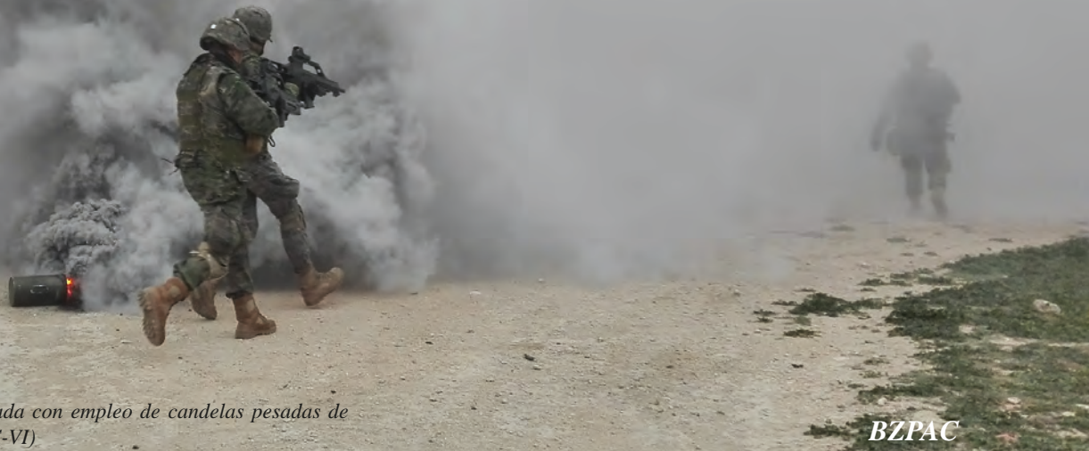
Asalto en zona urbanizada con empleo de candelas pesadas de ocultación