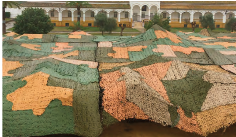
Vista parcial del despliegue del PC