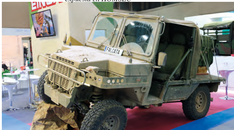
Foto inferior: la “Falcata”, todavía con el barro de Uceda, expuesta en HOMSEC