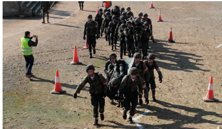
Prueba de traslado de heridos en el trofeo “GEBRIPAC”