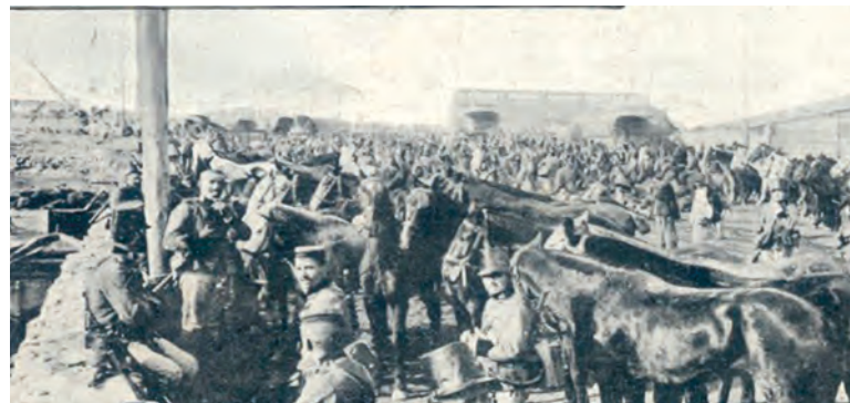
El “Lusitania” desembarca en Melilla para participar en la Guerra del Rif