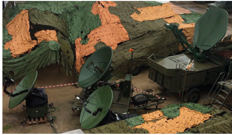
Medios satélite para mando y control del ejercicio

Es por ello que afronto esta etapa que da comienzo el 1 de enero de 2017, como un nuevo reto, con muchas ganas de trabajar y sobretodo de sumar por el bien común que nos une, que es España.