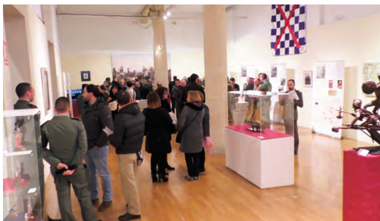
Vista general de la inauguración de la exposición