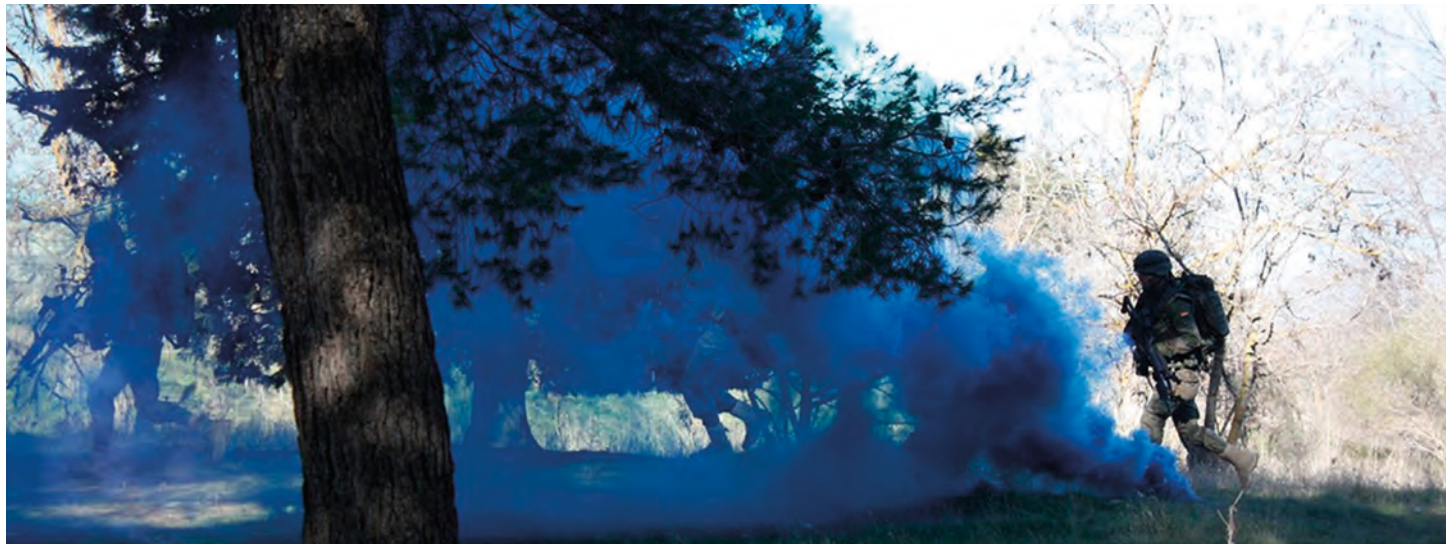
Foto inferior: un pelotón de la 2. a Cía. avanza oculto por el humo, durante un ejercicio de combate en población