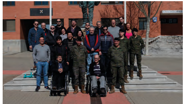
Foto de familia de la visita

Durante su estancia en la Base, tuvieron ocasión de asistir a diferentes sesiones de instrucción y visitar el Museo, pudiendo conocer la historia y el trabajo diario de nuestros paracaidistas.