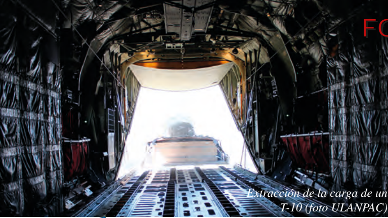
Extracción de la carga de un T-10