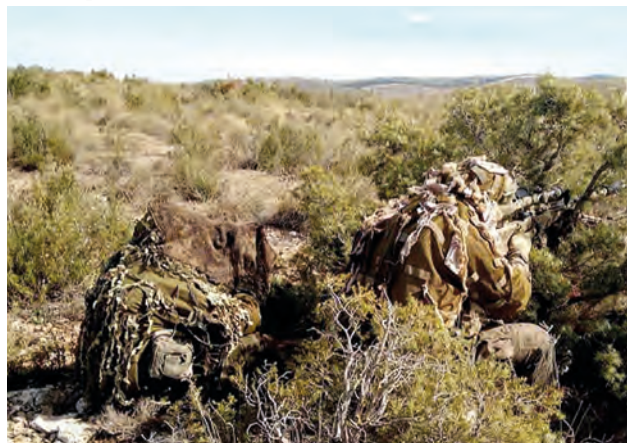
Equipo de tiradores de precisión durante el ejercicio

Sin más novedad, la mañana del 9 de marzo, la Bandera “Roger de Lauria” abandona el CMT Chinchilla sin dejar rastro, volviendo a la Base “Príncipe”, donde se empleará a fondo en la preparación del siguiente ejercicio.