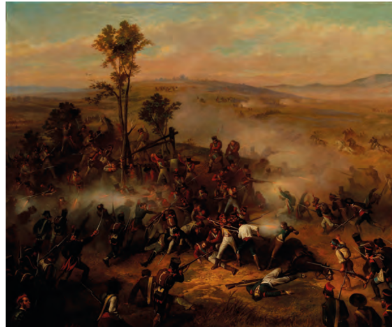
Foto superior: representación de la Batalla de Bailén, durante la Guerra de Independencia (1808-1813)