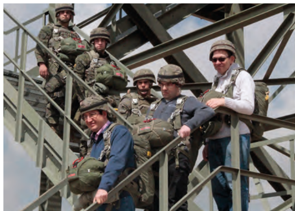
Un momento de la sesión fotográfica

Así, el 28 de marzo, tras una breve exposición del funcionamiento del CIPAE, varios componentes de dicha asociación departieron con el personal de la BRIPAC y se equiparon con paracaídas de instrucción para realizar la sesión fotográfica para el calendario.