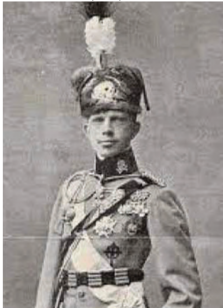
Foto superior: oficiales del Regimiento Lusitania en su campamento de Nador durante la Campaña del Rif Foto inferior: el Infante D. Fernando, Jefe del Regimiento durante la campaña de África