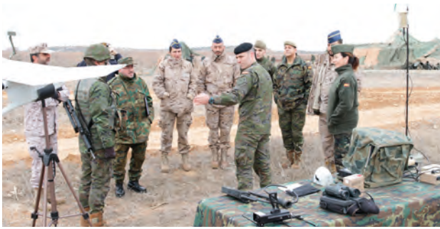
Un momento de la exposición de los medios ISTAR