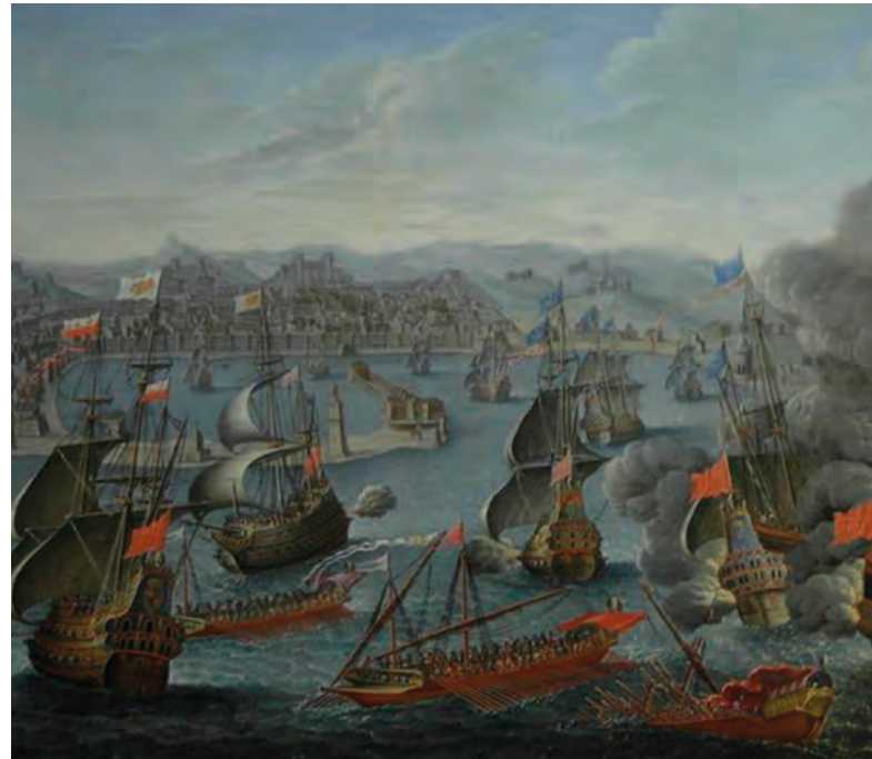
Batalla Naval de Palermo (1676)

Al iniciarse la guerra de la Independencia (1808-1813) se encontraba en Portugal, integrado en el ejército franco-español que ocupaba este país, pero al tener noticia de lo sucedido en España escapó de Oporto, para luchar contra los franceses en la Guerra de Independencia, uniéndose al Ejército de Galicia y tomando parte en la batalla de Medina de Rioseco, Bailén, Puente de la Herrenas, Bilbao, Zornoza, Valmaseda, Sodupe y Oarrantia. En 1809 el Regimiento participó en las de Tamames y Alba de Tormes. El 18 de marzo 1809, se distingue en la defensa del puente