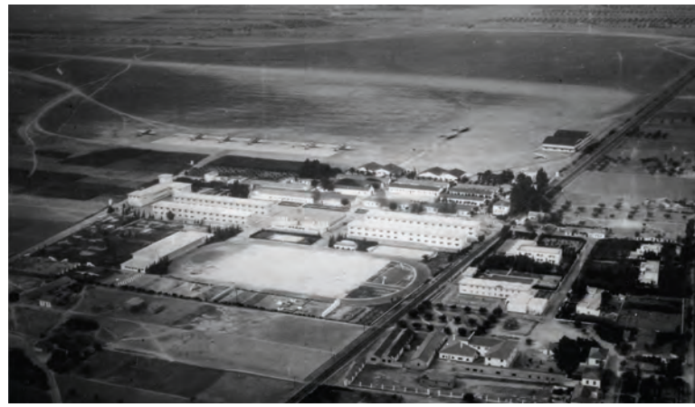
Foto aérea de la EMP en sus inicios

La labor de los profesores de la ACINF (Alcantarilla) es colaborar en la enseñanza de los cursos que se imparte como labor docente principal y funcionalmente desempeñan tareas de apoyo al mando, en este caso en favor de la Jefatura de Estudios de la EMP, para la coordinación, programación, dirección y evaluación del centro.