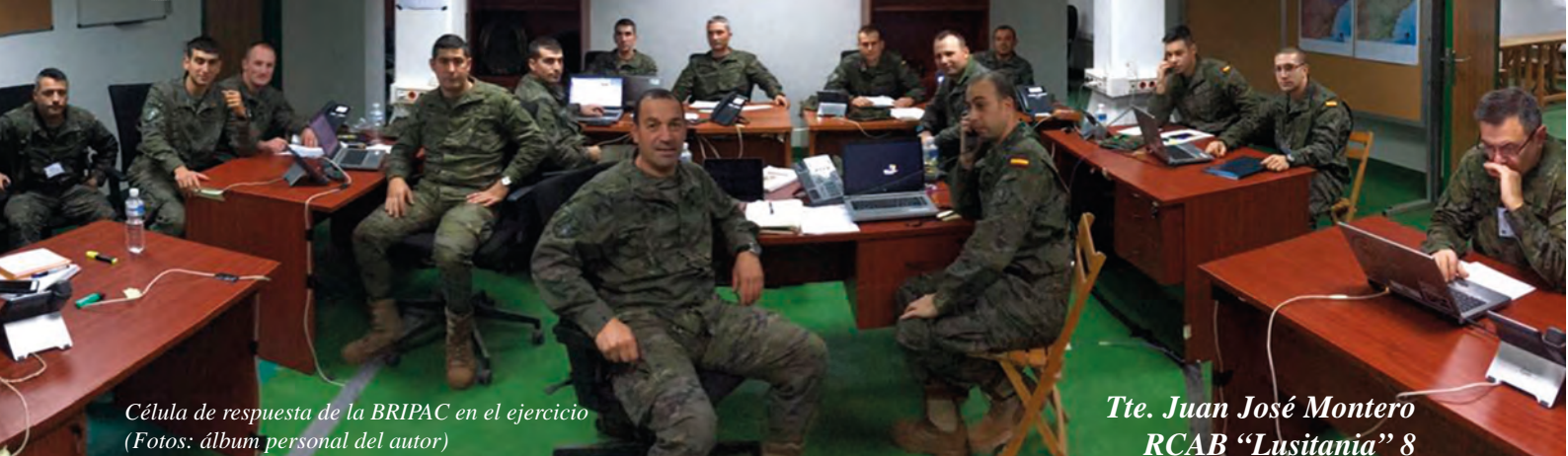
Célula de respuesta de la BRIPAC en el ejercicio