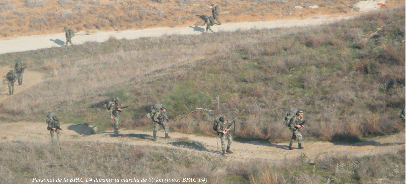
Personal de la BPAC I/4 durante la marcha de 60 km