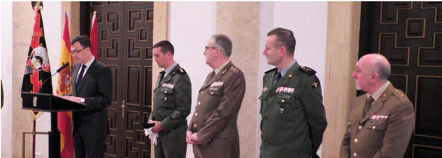
Momento de la alocución del Alcalde de Murcia