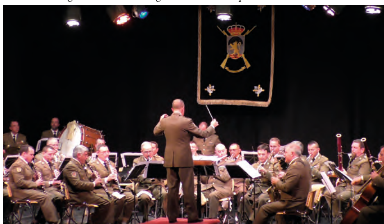
Un momento del concierto de música Interpretación del Himno de la BRIPAC