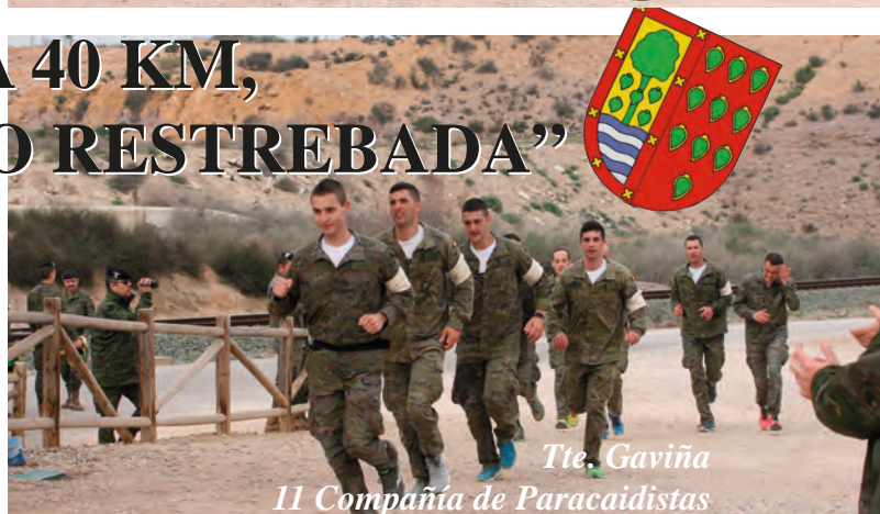
Tte. Gaviña 11 Compañía de Paracaidistas

El 10 de febrero tuvo lugar una de las pruebas más duras en el marco de las competiciones deportivas, celebradas con motivo del 23 de febrero: la marcha paracaidista “Memorial CLP Cao Restrebada”, una carrera a pie de 40 kilómetros que cada equipo de las unidades de la BRIPAC, debe recorrer en el menor tiempo posible, atendiendo a ciertas bonificaciones y penalizaciones.