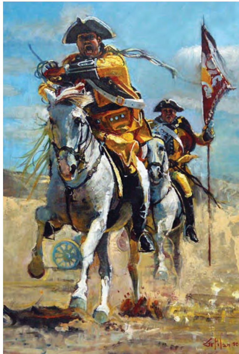
Foto superior: representación de una carga de los Dragones del Lusitania

Combate de Velastegui, acciones de Belascoain y San Lorenzo, defensa de Logroño, acción de Obanos, ataque y toma de Aoiz, Huarte y Villaba, socorro de Lumbier, acciones de Sierra de Leire y Ermita de la Trinidad, combate de Azcoyen, ataque y toma de Urroz, Alzuza, Miravalles, San Cristóbal y Oricain (1875), acción y toma de Villareal, ataque y toma del Fuerte de San Antonio de Urquiola y batalla de Elgueta realizando su reputación.