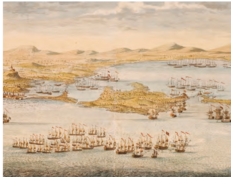
Foto superior: asedio a Cartagena de Indias, donde el Rgto. de Lisboa destacó a las órdenes de Blas de Lezo (1741)