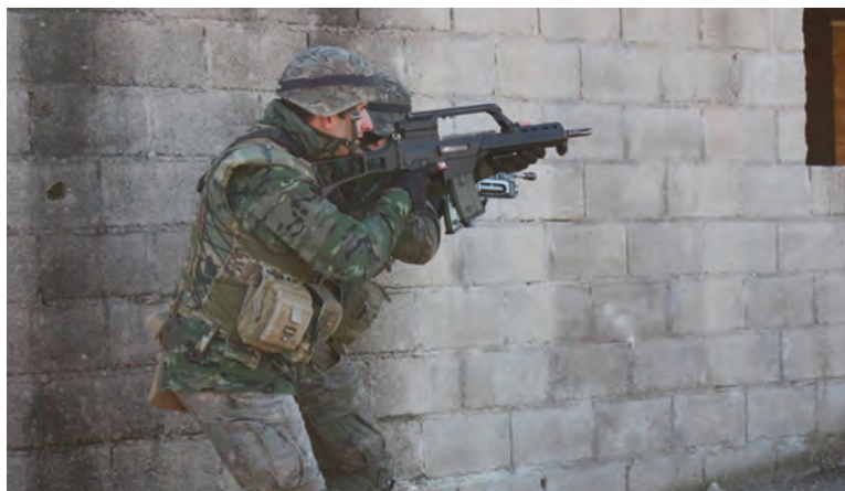
Un binomio de la 2. a Cía. avanza para asaltar una edificación

Durante su desarrollo se llevaron a cabo distintos ejercicios de fuego real y adiestramiento de sección y subgrupo táctico, destacando la realización de una operación de reconocimiento de ruta con limpieza de itinerarios con zapadores, en la que se insertó a la unidad, mediante lanzamiento paracaidista desde helicóptero HT-17 “Chinook” (Boeing CH-47), sobre la zona de salto (D/Z) de “La Felipa” y que acabó con un ataque sobre una posición defensiva.