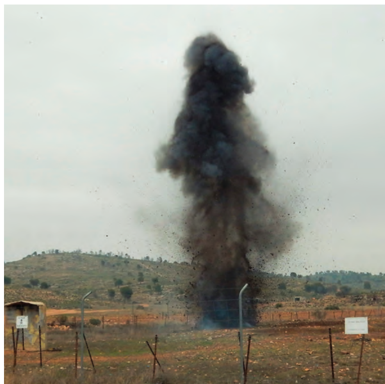
Ejercicio de apertura de brechas

En estas ALFAS REUNIDAS la Brigada Paracaidista ha seguido avanzando en la interoperabilidad de sus unidades, aspecto fundamental para el éxito de la misión.