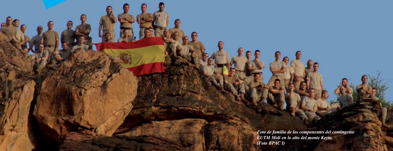
Foto de familia de los componentes del contingente EUTM Mali en lo alto del monte Keyta.