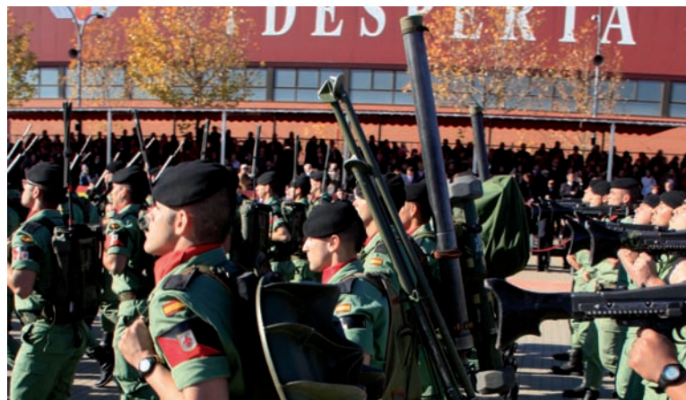
Sección de Armas de la BPAC I durante la Parada Militar