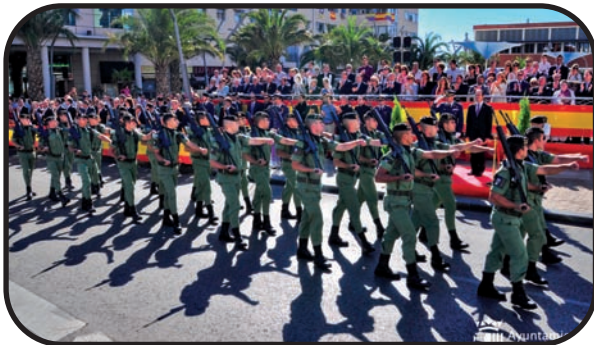
Foto superior: la sección de la BRIPAC a su paso por la tribuna de autoridades Foto inferior: Momento del izado de la Bandera