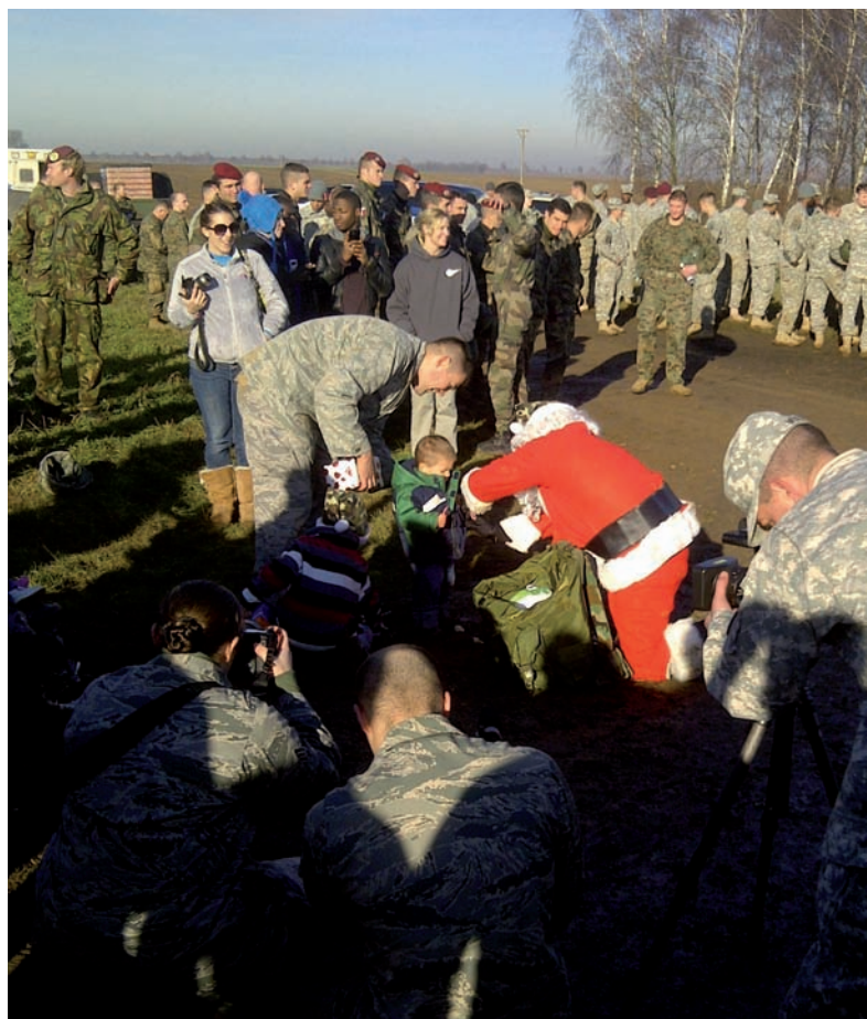
Papa Noel entrega los regalos a los niños