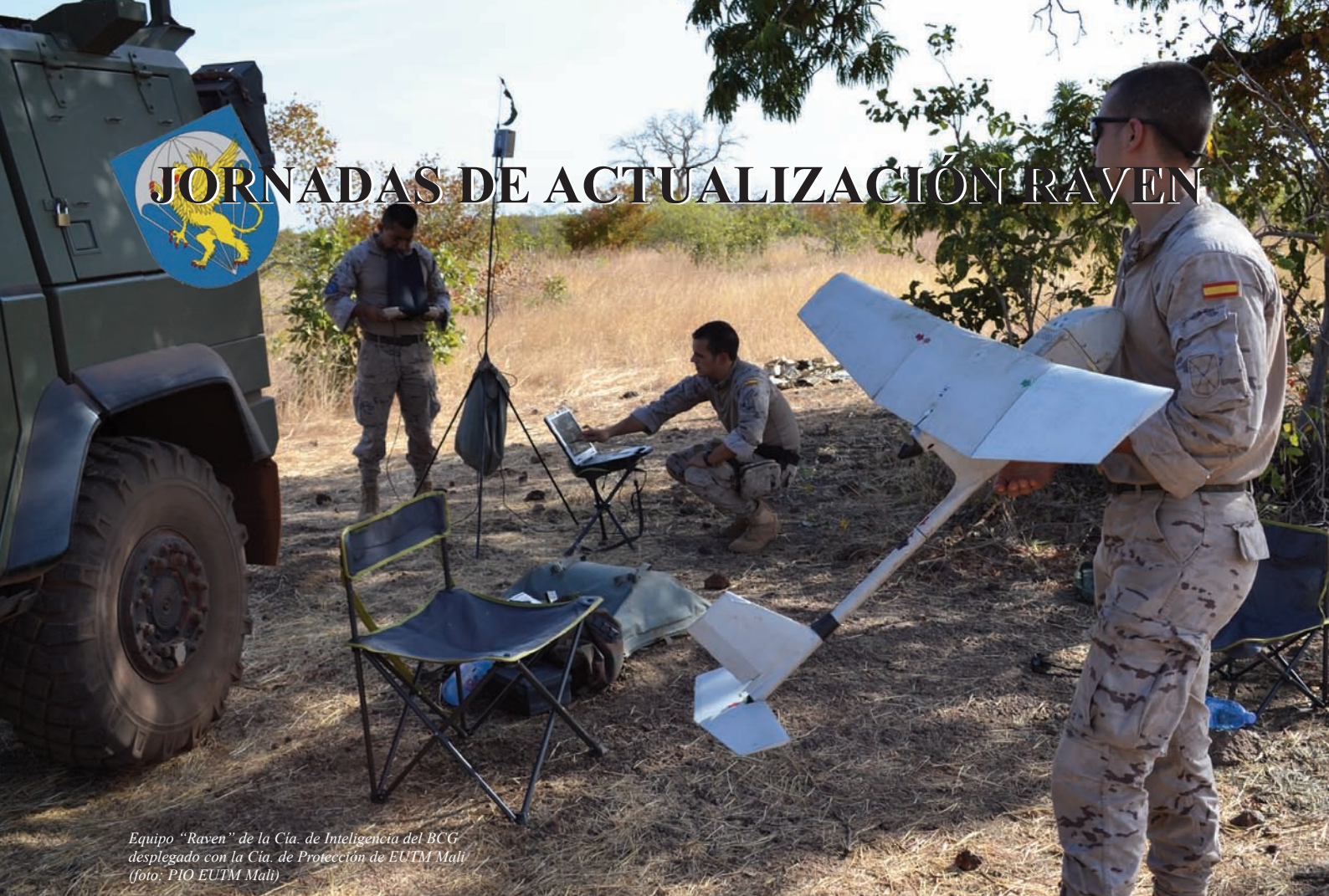
Equipo "Raven" de la Cía. de Inteligencia del BCG desplegado con la Cía. de Protección de EUTM Mali

La Compañía de Inteligencia del Batallón de Cuartel General ha llevado a cabo las Jornadas de Actualización Mini-UAV "Raven", asignadas por el Mando de Fuerzas Ligeras a la Brigada Paracaidista, entre los días 23 de septiembre y 4 de octubre.