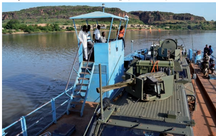
Foto inferior: Travesía en el transbordador del río Níger