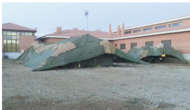
Imágenes de los diferentes despliegues realizados durante el ejercicio