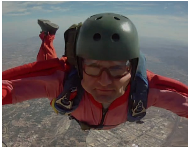
El autor del artículo durante la caída libre de uno de sus saltos