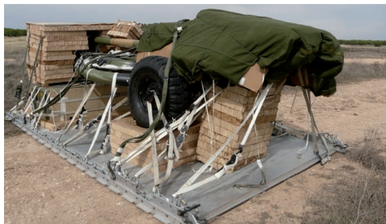
El light gun tras el lanzamiento

Cada día hubo una única rotación, compuesta por tres aeronaves, que en primer lugar lanzaban en automático simultáneamente escalonadas en altura, para, posteriormente, una de ellas elevarse hasta los 12.000ft y lanzar al personal en la modalidad de apertura manual. Como anécdota, cabe señalar que el primer día