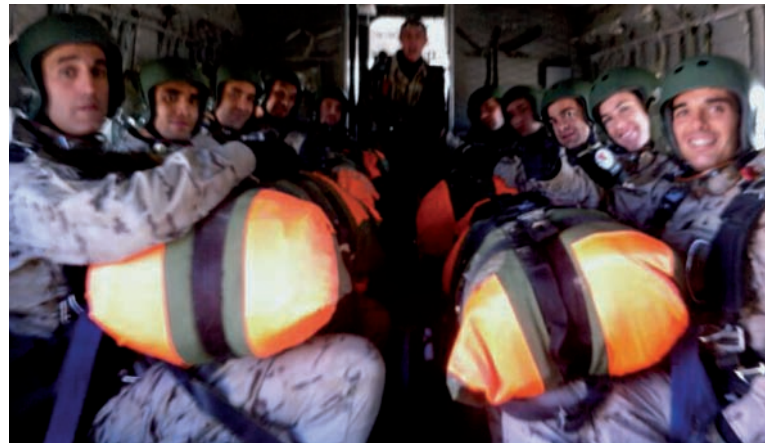
Arriba: Patrulla embarcada para realizar uno de los saltos con equipo Abajo: Foto de familia de la patrulla del autor