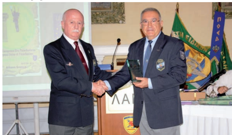
Foto inferior: el Cte. de la Macorra entrega un recuerdo al presidente de la Federación griega