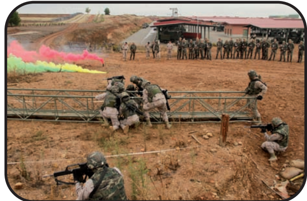
Arriba: los alumnos observan como nuestros zapadores realizan el montaje de la pasarela.