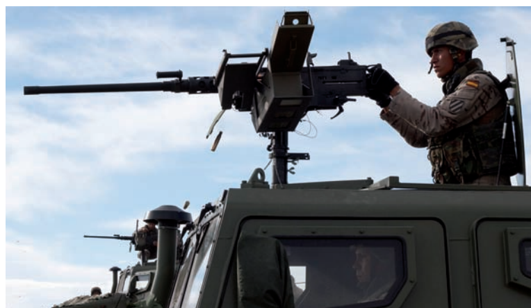
Instrucción de tiro con ametralladora pesada desde un VAMTAC