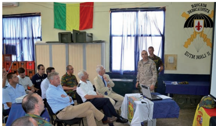
El jefe de la Compañía efectuó una detallada presentación al ministro belga sobre la composición y capacidades de la Unidad (PIO EUTM Mali)

Posteriormente se celebró una Parada Militar presidida por el coronel García Cortijo. Tras oír