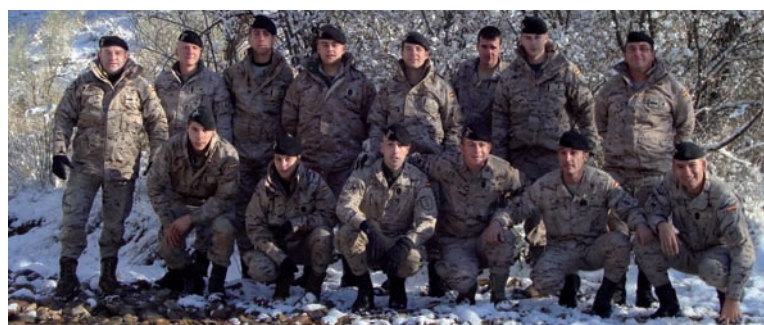
Personal participante en el curso