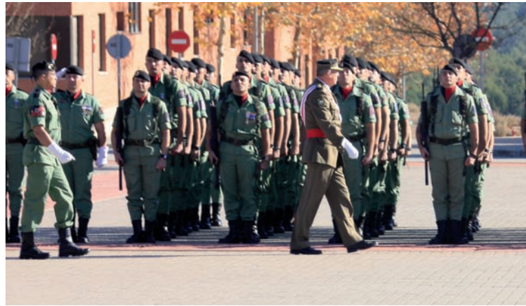
El Gral. Cifuentes pasa revista a la fuerza

Finalmente, las unidades desfilaron entre aplausos ante las autoridades e invitados que llenaban las tribunas y que posteriormente pudieron disfrutar de la exposición de material de dotación y del museo de la BRIPAC