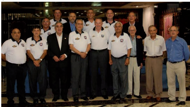
Foto superior: foto de familia de la cena de Palo Alto Foto inferior: foto de familia de los veteranos asistentes al acto de Maspalomas