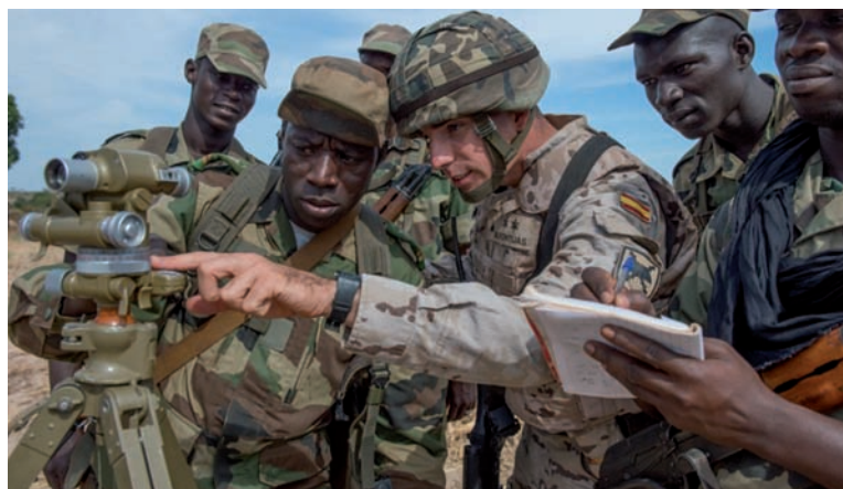
Comprobando la estación del goniómetro durante la evaluación

Sólo quedan en tierras africanas el personal del Equipo de Instructores de Apoyo de Fuegos que con el nuevo año inician la instrucción de un nuevo batallón.