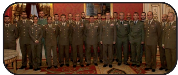
Foto de familia del acto de entrega de trofeos deportivos

Este trofeo es resultado de los excelentes resultados de la participación nuestros equipos en los diferentes campeonatos nacionales.