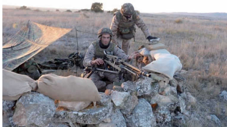
CLP Arroyo y Seoane (3. a y 5. a Cía.) en una posición defensiva