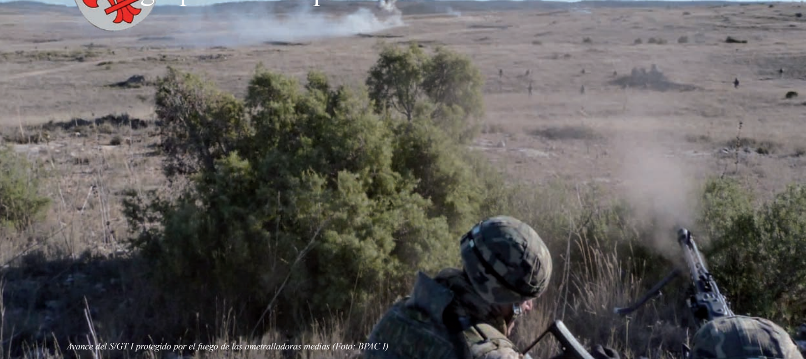
Avance del S/GT 1 protegido por el fuego de las ametralladoras medias

Un grupo táctico que cohesiona a toda la BRIPAC