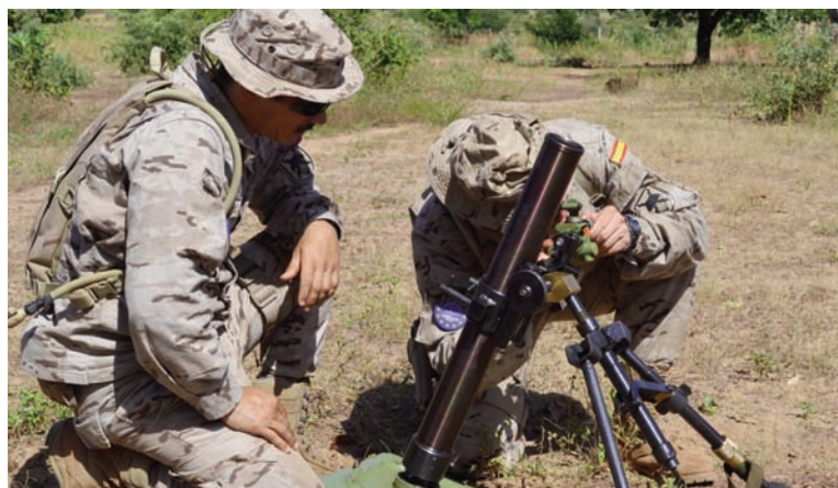
Situando el mortero en posición para el inicio de la instrucción (PIO EUTM Mali)

En el campo de entrenamiento de Koulikoro, se han impuesto las medallas al Servicio de la