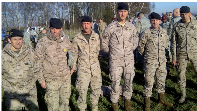
Foto superior: personal de la BRIPAC asistente al ejercicio Foto inferior: foto de grupo de personal participante en el ejercicio