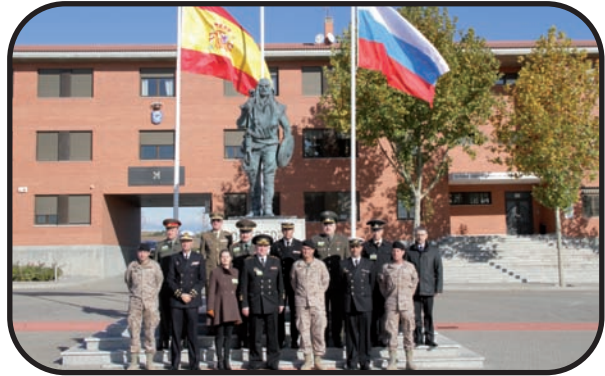
Arriba: Foto de familia de la visita

La visita finalizó en el museo de la BRIPAC donde el vicealmirante estampó su firma en el libro de Honor, destacó el alto nivel de preparación de esta Brigada y agradeció el trato recibido.