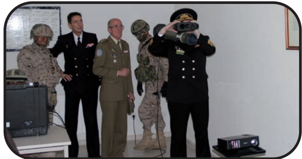
Abajo: el vicealmirante Volozhinsky prueba el simulador del C-90