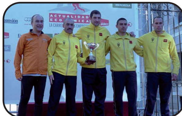
Equipo vencedor en la prueba de 10 km