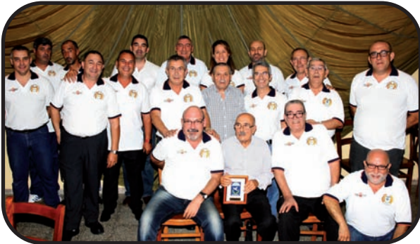
Arriba: foto de familia de los asistentes