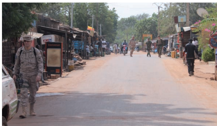
foto superior e inferior: diferentes momentos de la patrulla a pie por Koulikoro