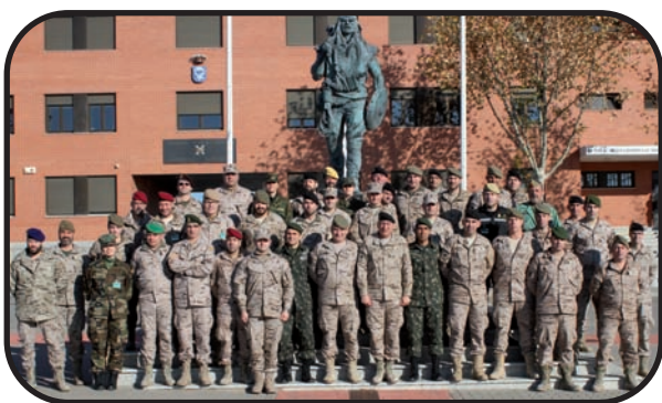
Arriba: Foto de familia de la visita Abajo: un momento de la exposición de material