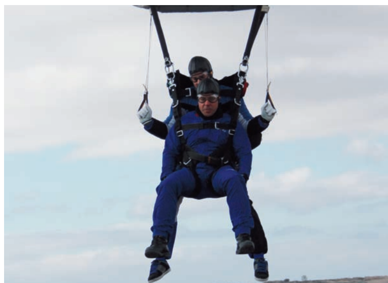
Foto superior: Piloto y pasajero a punto de tomar tierra durante el curso