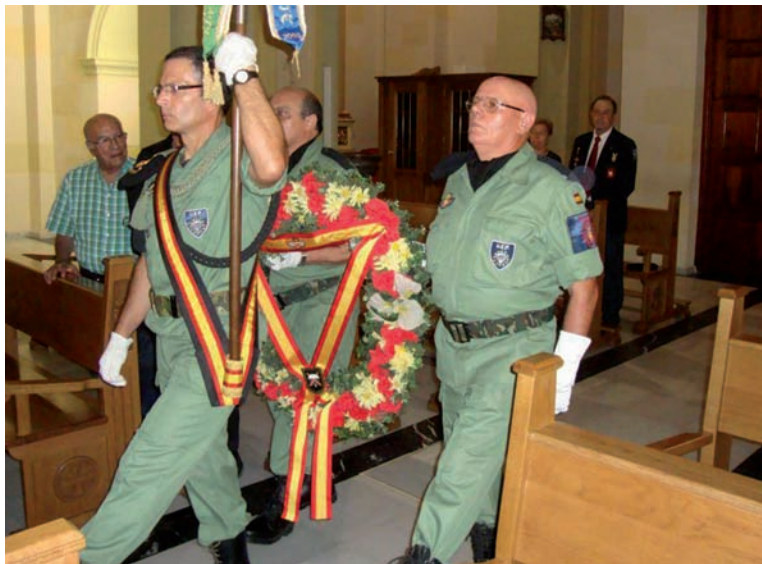
Homenaje a los caídos en el aniversario de la Asociación de Alicante

Finalizó la visita con una comida de Hermandad en el Club Aeronáutico en un auténtico ambiente PARACAIDISTA.