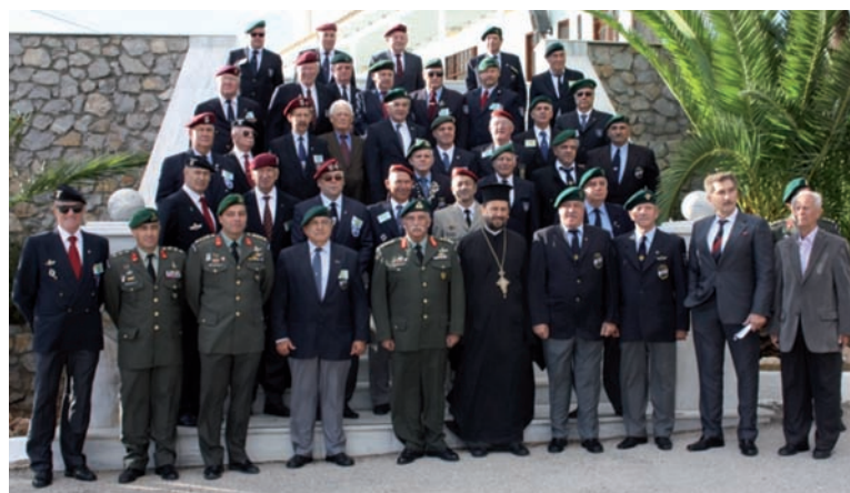
Foto de familia de las diferentes delegaciones nacionales

Los días 19 y 20 se visitan la Acrópolis de Atenas, el Museo Nacional de Arqueología, canal de Corinto, Micenas, Epidauro y Naoplia, parando en algunas municipalidades invitados por la autoridad, siendo recibidos con gran cariño y respeto.