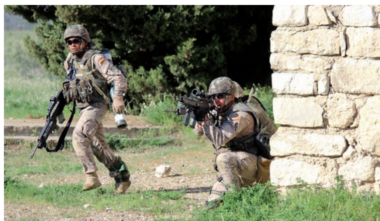
Foto superior: apoyando el avance en combate en zonas urbanizadas Foto inferior: avance sobre posiciones enemigas en loma del quemado