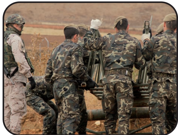
Abajo: Los alumnos practican con la pasarela bajo la supervisión del personal de zapadores