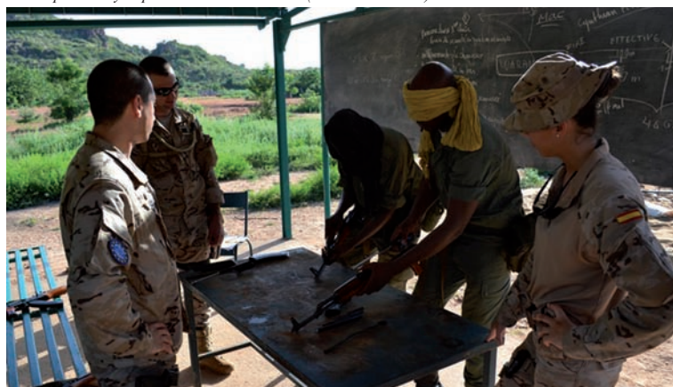
El equipo de apoyo de fuegos en instrucción de armamento individual (PIO EUTM Mali)