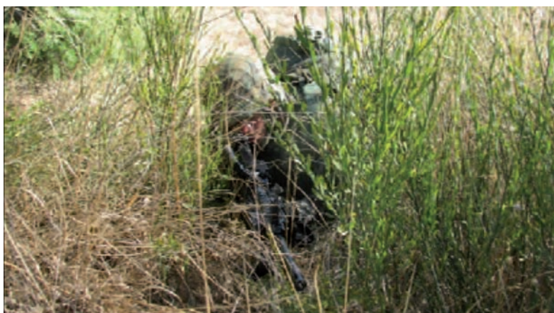
Preparando el hostigamiento