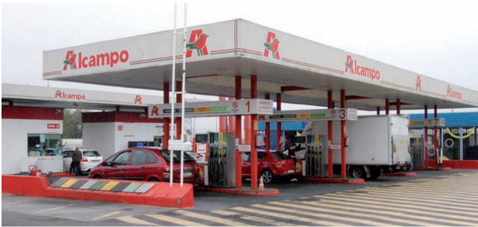
“La gasolinera más barata de la zona y dos grandes talleres para el automóvil”