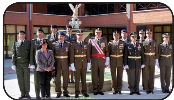
Foto de familia del personal de la Sección de Administración Económica

Los actos dieron comienzo con una misa en honor a la Patrona, a la que continuó un breve acto en el que se entregaron los premios “Intendente de Honor” a todos aquellos componentes de la Brigada que han destacado en sus labores relacionadas con la Intendencia.