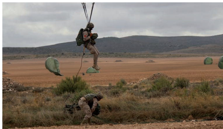
Lanzamiento de uno de los subgrupos tácticos durante el ejercicio

En esta salida, esta sección realizó acciones para dificultar el movimiento y operaciones de las unidades en el campo de maniobras; entre ellas, emboscadas complejas, pequeños hostigamientos (nocturnos y diurnos) y una operación defensiva en combate en población.