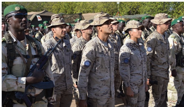
Formación española en el acto de despedida del Batallón “Sigi” (PIO EUTM Mali)