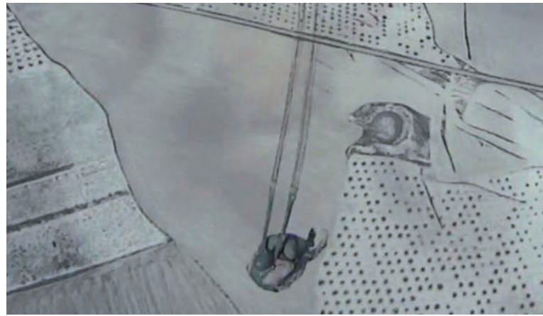
Vista de la salida de un saltador desde la rampa del avión

El curso finalizó con la novedad de que uno de los cuarenta miembros iniciales del curso no pudo terminarlo debido a una lesión de tobillo durante un lanzamiento. Ya se habían terminado estas cinco semanas de alumno, y ya estábamos preparados para empezar la vida real en nuestras unidades de origen, y en mi caso poder desempeñar cualquier misión propia de un mando destinado en la Brigada Paracaidista.