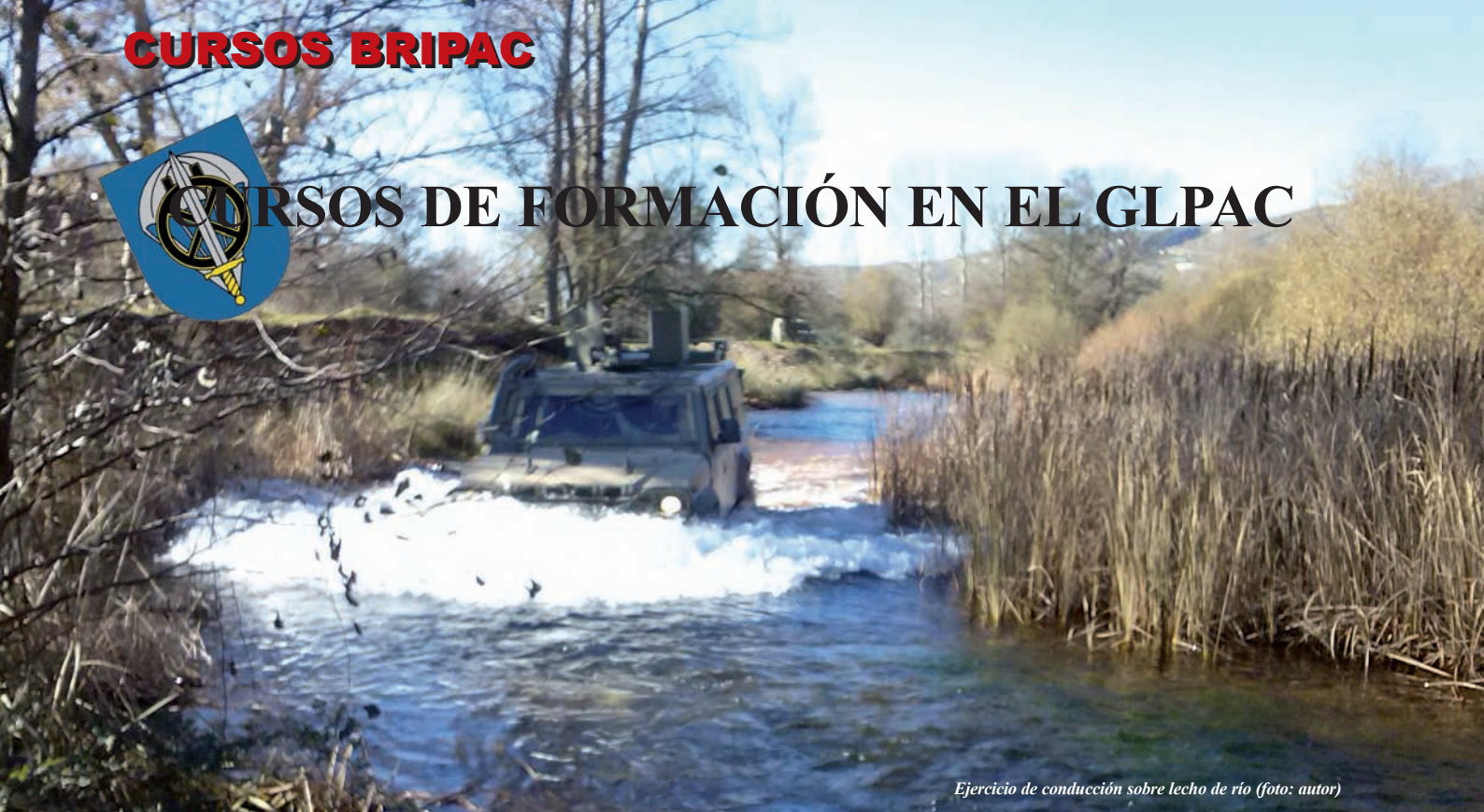
Ejercicio de conducción sobre lecho de río