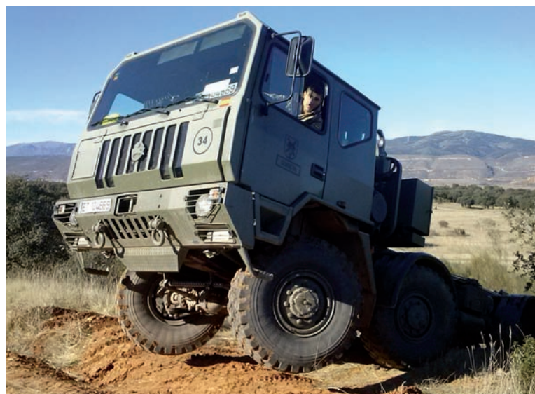
Paso de obstáculo con vehículo pesado