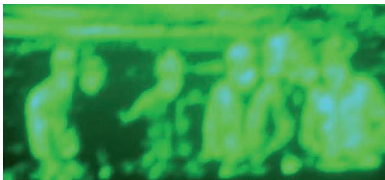
Vista del enemigo a través de las gafas de visión nocturna