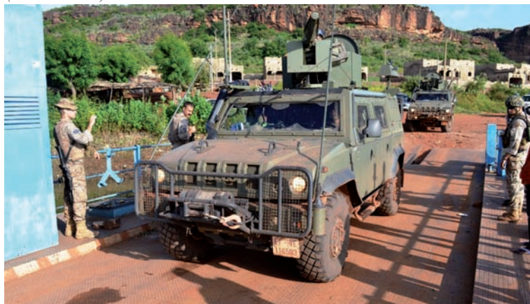
Foto superior: Embarcando los vehículos LMV “Lince” (PIO EUTM Mali)