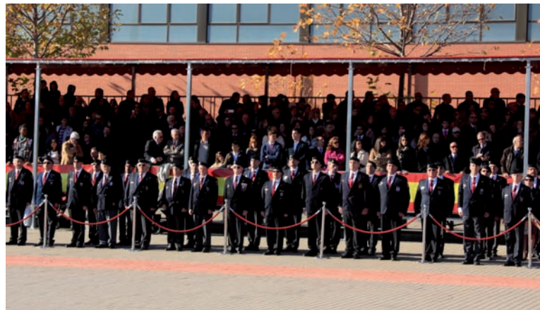
Foto superior: nuestros veteranos siempre presentes en todos nuestros actos.