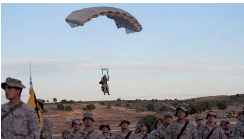
Foto superior: saltador APM a punto de tomar tierra en las proximidades de la formación de la 12.ª Cía.