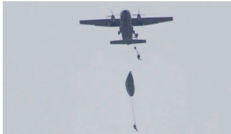
La salida de los saltadores vista desde el suelo