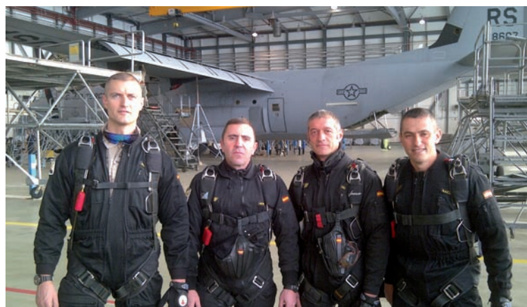
Foto inf rior: Los miembros de la ULANPAC equipados para lanzamiento en la B.A. de Ramstein