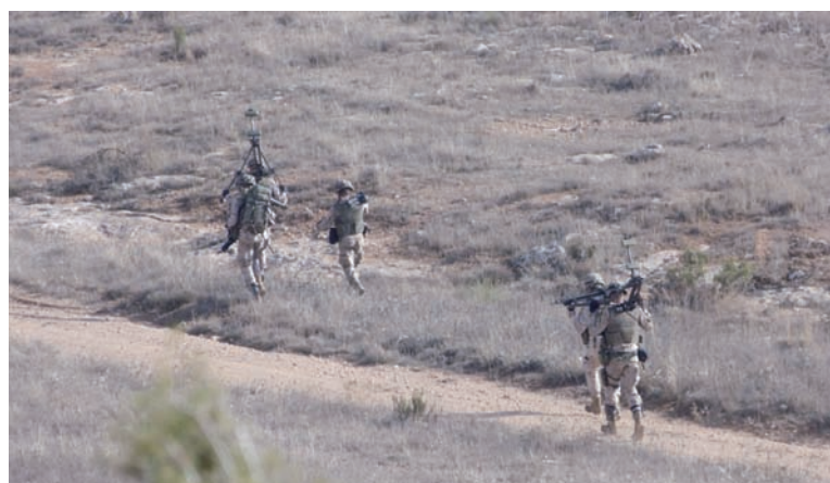
Foto superior: Los elementos de apoyo se dirigen hacia sus posiciones Foto inferior: Puesto de Mando Avanzado del GTPAC en avance para ofensiva