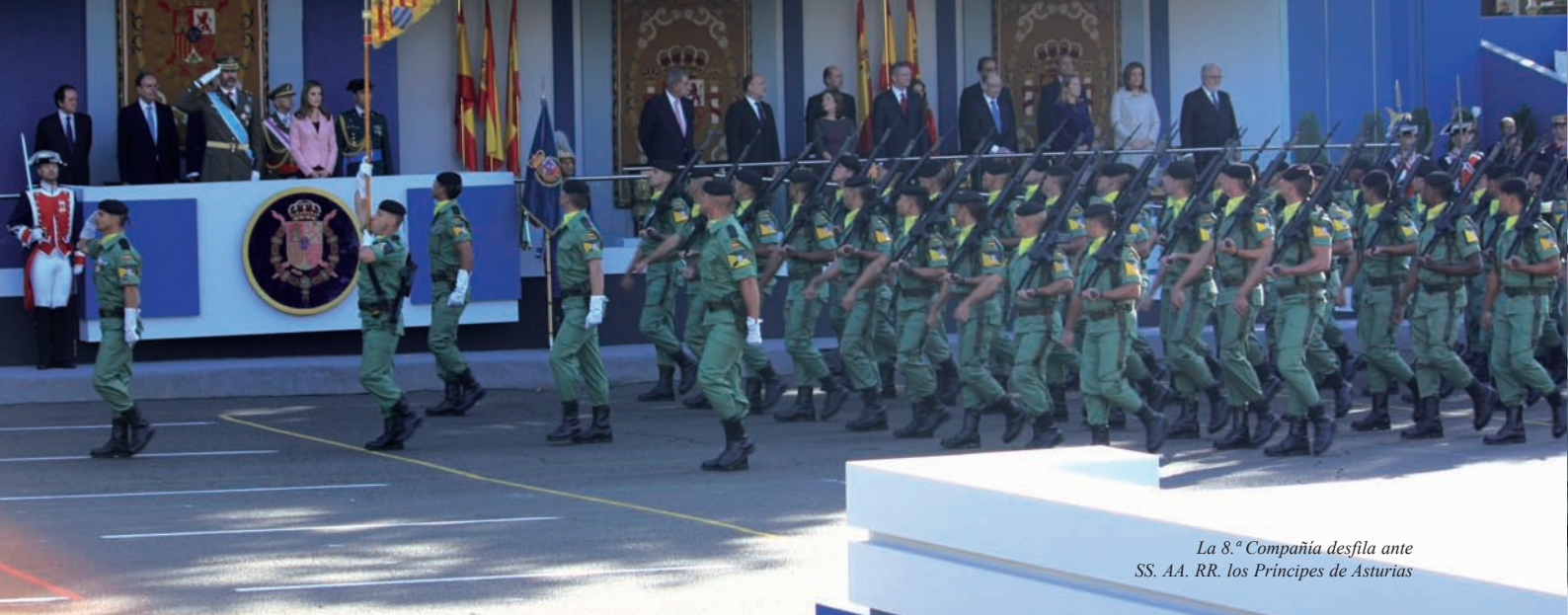
La 8.ª Compañía desfila ante SS. AA. RR. los Príncipes de Asturias

La llegada del verano trajo a la Brigada una grata noticia. Por corresponderle a la Brigada de Infantería Acorazada (BRIAC) “Guadarrama” n.º XII, ser el núcleo del contingente español en el Líbano, nuestra Brigada debía liderar por segundo año consecutivo, el desfile terrestre que se celebra en Madrid con motivo del Día de la Hispanidad (este liderazgo se realiza de forma alternativa entre los generales jefes de la BRIAC y BRIPAC).