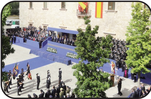
Vista general del acto realizado en el Palacio Arzobispal de Alcalá de Henares