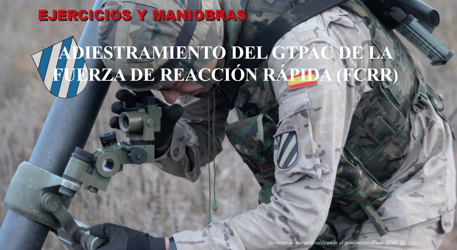
Sirviente de mortero calibrando el goniómetro