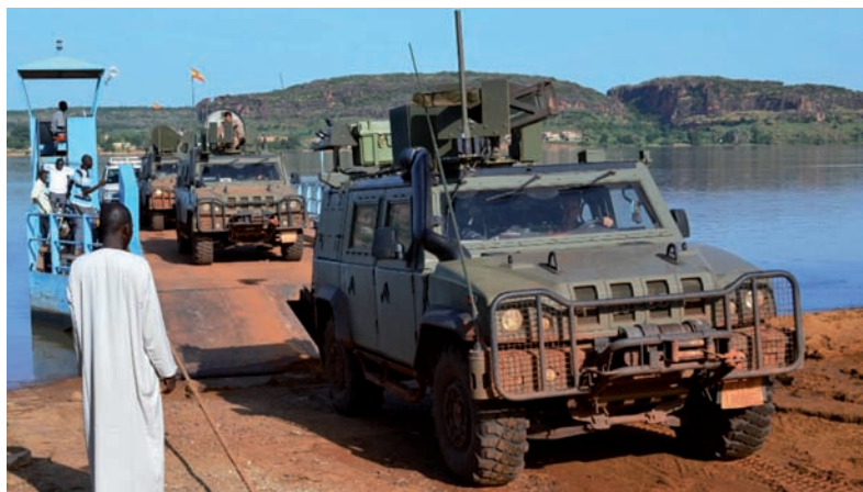
Desembarco de los vehículos LMV "Lince" en la orilla opuesta (PIO EUTM Mali)

La Compañía de Protección de EUTM Mali, realizó su primera patrulla a pie en el interior de