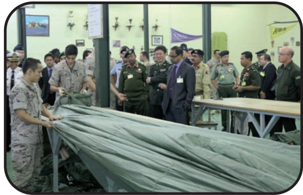
Arriba: un momento de la visita a la sala de plegados Abajo: prestando especial atención a la instrucción en el CIPAE

La visita finalizó con la foto de familia y el intercambio de presentes.