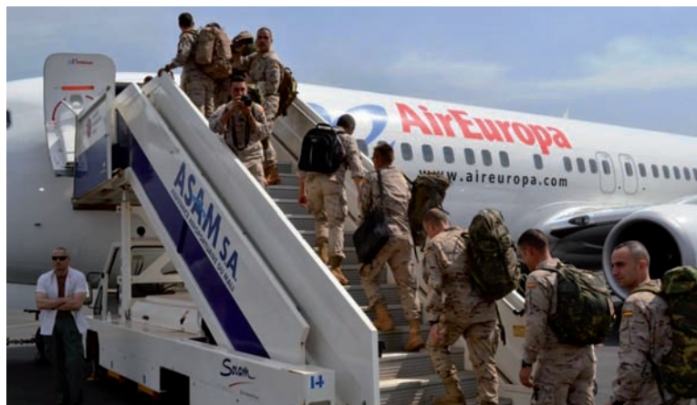
Foto inferior: el personal de la BRIPAC embarca en el aeropuerto de Bamako tras finalizar la misión