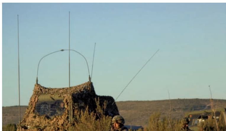
Mula de transmisiones de PCAV de GTPAC

Por otro lado, el DENAAA se integra en el puesto de mando de Brigada, permitiendo al general ejercer el mando y control sobre su defensa antiaérea.