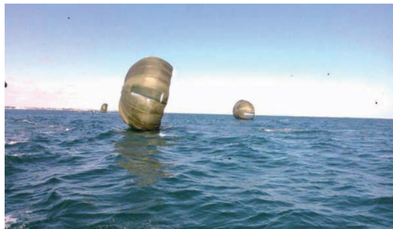
Arriba: Salto en el mar Abajo: Salto en D/Z externa